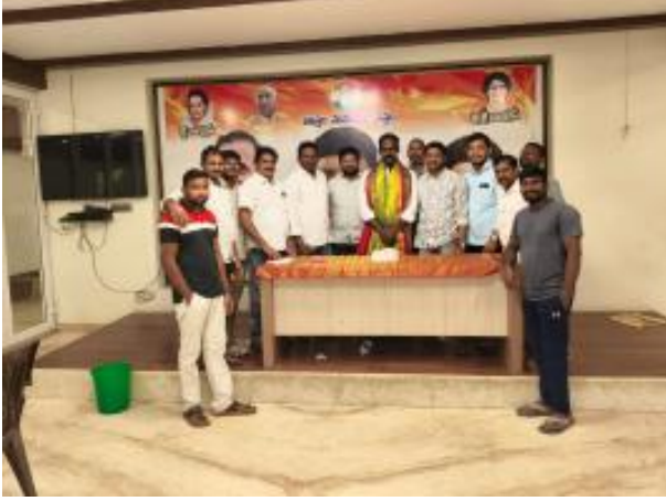
ఖమ్మం బ్యూరో, (భారత శక్తి) నవంబర్ 21: జోనకల్