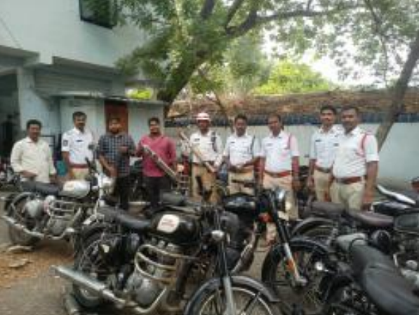
ఖమ్మం ప్రతినిధి (భారత శక్తి న్యూస్ ), నవంబర్ 21:మోడిఫైడ్ సైలెన్సర్లు అమర్చిన బుల్లెట్ వాహనాల సైలెన్సర్లను