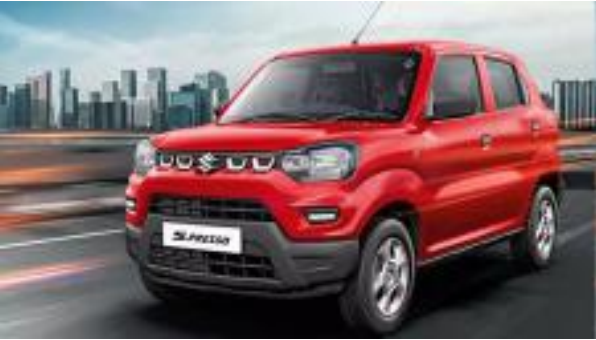
సెగ్మెంట్ విక్రయాలు ఆగస్టులో 10,648 యూనిట్లుగా నమోదయ్యాయి. క్రితం ఏడాది ఈ సంఖ్య 12,209గా ఉంది.

మారుతీ సుజుకీలో ఆల్టో, ఎస్-ప్రెసోతో కూడిన మినీ కార్ల