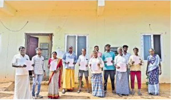
జూలపల్లి , డిసెంబర్ 8

:మండలం చీమలపేటలో ఓటరుజాబితా విడుదల చేస్తున్న అధికారులు, ప్రజాప్రతినిధులుఎన్నికల సంఘం ఆదేశాల మేరకు జిల్లాలో గత కొద్ది రోజులుగా పంచాయతీ అధికారులు వార్డుల వారీగా ఓటరు జాబితా వడబోత చేపట్టి ముసాయిదా ఓటరు జాబితా విడుదల చేశారు. జిల్లాలో 4,08,58 మంది గ్రామీణ ఓటర్లుగా నమోదయ్యారు. ఇందులో 2,01,164 పురుషులు, 2,06,881 మహిళలు, 13 మంది ఇతరుగా తేలారు. స్థానిక సంస్థల ఎన్నికల కోసం ఈనెల 21 వరకు ఓటరు జాబితాపై అభ్యంతరాలు స్వీకరిస్తున్నారు. ఆయా అంశాలపై గ్రామ పంచాయతీ కార్యదర్శులకు ఫిర్యాదు చేయవచ్చని అధికారులు పేర్కొంటున్నారు. మహిళలే అధికంజిల్లాలో వల్లె ఓటర్లలో మహిళలే పైచేయిగా నిలిచారు. జిల్లా మొత్తం ఓటర్లలో 49.30 శాతం పురుషులు, 50.70 శాతం మహిళలుగా నమోదయ్యారు. ముసాయిదా ఓటరు జాబితాపై ఈనెల 18న జిల్లా స్థాయిలో కలెక్టర్, 19న మండల స్థాయిలో ఎంపీ డివీలు రాజకీయ పార్టీల ప్రతినిధులతో సమావేశాలు నిర్వహిస్తారు. ఈనెల 26లోపు అభ్యంతరాలను పరిశీలించనున్నారు. 28న తుది ఓటరు జాబితా విడుదల చేయనున్నారు.