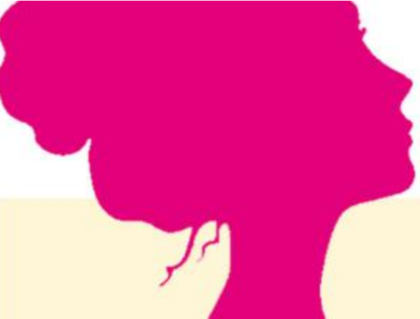
కరీంనగర్ డిసెంబర్ 8

:ఎన్నడూ నిన్ను విడిచిపోను.. జీవితాంతం తోడుంటాను.. నీ నీడనై నిలుస్తాను.. అని అగ్నిసాక్షిగా ప్రమాణం చేసి.. ఏడడుగులు నడిచిన ఆ అర్ధాంగి ఆయనలో సగభాగమై సవర్ణలు చేస్తూ కంటికి రెప్పలా కాపాడుకుంటోంది.