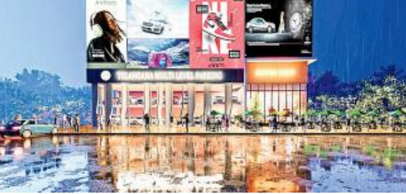
హైదరాబాద్,, డిసెంబర్ 8

: సరైన పార్కింగ్ వసతి దొరికితే రోడ్లపై నిలిచే వాహనాలు తగ్గుతాయి. ట్రాఫిక్ సమస్య పరిష్కారమవుతుంది. ఈ సూత్రాన్ని సాకారం చేసేందుకు జీహెచ్ఎస్సీ శ్రీకారం చుట్టింది. గత సర్కారు నాంపల్లిలో ప్రారంభించిన 15 అంతస్తుల పార్కింగ్ కాంప్లెక్సు నిర్మాణం దాదాపు పూర్తయింది. రాష్ట్ర ప్రభుత్వం నూచనతో కమిషనర్ ఆఫ్రుపాలి మరిన్ని కాంప్లెక్సుల నిర్మాణానికి నడుం బిగించారు. ఇటీవల ఓ కమిటీని నియమించారు. దీని ఆధ్వర్యంలో కొత్త పార్కింగ్ కేంద్రాల నిర్మాణానికి స్థలాల ఎంపిక, నూతన