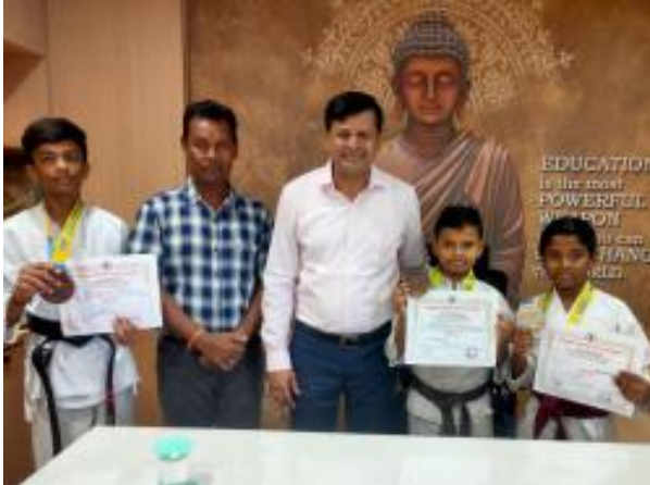
పాధ్యాయ బృందం, విద్యార్థులు పాల్గొన్నారు.