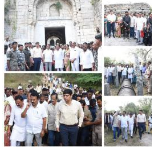
(భారత శక్తి ప్రతినిధి) కామారెడ్డి, డిసెంబర్ 08: అత్యంత