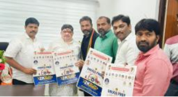
హైదరాబాద్ (భారత శక్తి) డిసెంబర్ 10: తెలంగాణ విద్య సమితి అధ్యక్షులలో డిసెంబర్ 21 న నెక్సెన్ రోడ్డు నందు