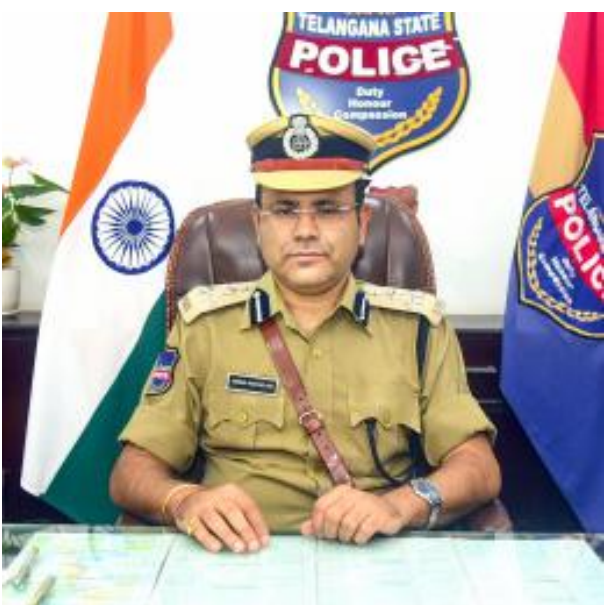
హనుమకొండ ప్రతినిధి(భారత శక్తి)డిసెంబర్13:వరంగల్