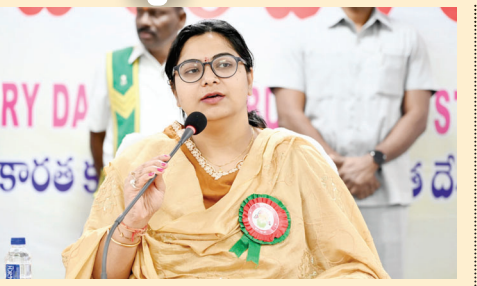
అస్పిరేషనల్ బ్లాక్స్ ప్రోగ్రామ్ కింద గత రెండు సంవత్సరాల్లో పలు చర్యలు తీసుకున్నారు. విద్యా వాలంటీర్లను నియమించడం, సాయంత్రం ప్రత్యేక