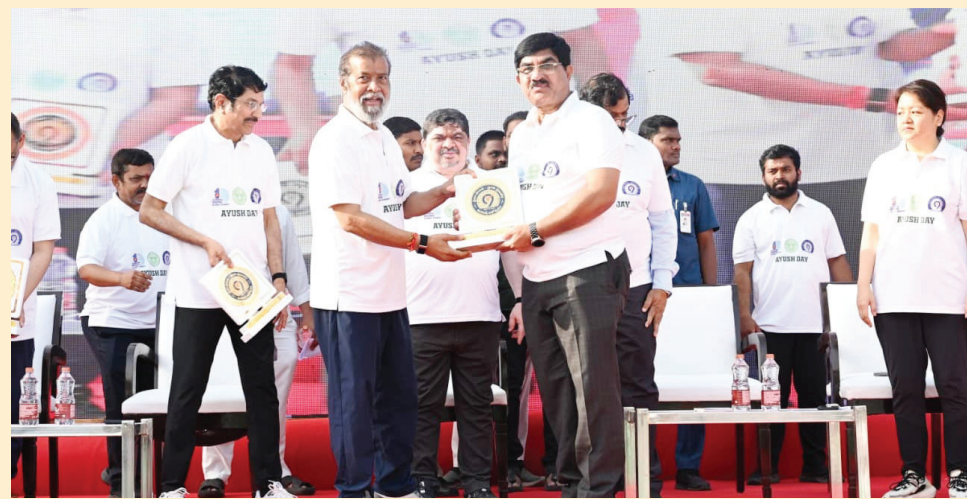
* ఒత్తిడిని జయించేందుకు నిత్య సాధన అవసరం: మంత్రి దామోదర్ రాజనల్నింపా