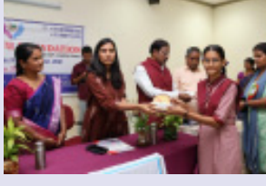
సందర్శించారు. ఈ సందర్భంగా విద్యార్థులతో నిర్వహించిన సమావేశంలో కలెక్టర్ మాట్లాడుతూ ఇంటర్ తర్వాత ఉండే పోటీ పరీక్షలకు ఇప్పటి నుంచే సిద్ధమవ్వాలని సూచించారు. విద్యార్థి జీవితంలో 9వ తరగతి నుంచి 12వ తరగతి వరకు అత్యంత కీలక దశగా పేర్కొన్నారు. ఈ సమయంలో కష్టపడి చదివితే భవిష్యత్తులో ఉన్నత స్థానాలకు చేరుకోవచ్చని తెలిపారు. ప్రతి విద్యార్థి తన లక్ష్యాన్ని