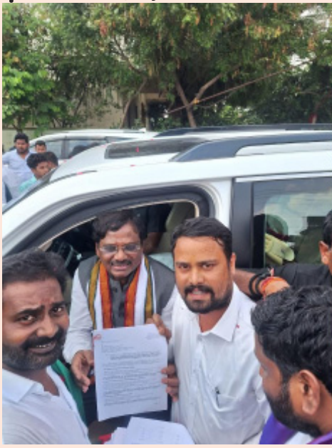
చోటుచేసుకుంటున్నాయని ఆయన ఆవేదన వ్యక్తం చేశారు.

అలాగే 2019, 2021, 2023 సంవత్సరాల తనిఖీలలో యంత్రాలకు భద్రత గార్డులు లేవని స్పష్టంగా గుర్తించినప్పటికీ యాజమాన్యం ఎలాంటి చర్యలు తీసుకోలేదని, ప్రమాదకర రవాణాను ఉపయోగించే ఫ్యాక్టరీలో హాజర్ అనాలిసిస్ నివేదికలు లేకపోవడం అత్యంత ఆందోళనకరమని అన్నారు. ప్రతి ఏడాది తనిఖీల్లో లోపాలు బయటపడుతున్నప్పటికీ సంబంధిత అధికారులు కఠిన చర్యలు తీసుకోకపోవడం వల్లే ఇటువంటి విషాద ఘటనలు