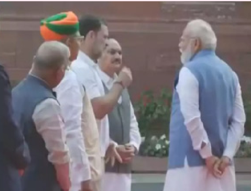
ఒకటి తీవ్ర విమర్శలు చేసుకుంటున్న ఈ సమయంలో వీరిమధ్య చోటుచేసుకున్న ఈ చిన్నపాటి సంభాషణ ఆకట్టుకుంటోంది.

న్యూఢిల్లీ ఏప్రిల్ 10 పార్లమెంట్ ప్రాంగణంలో శనివారం ఉదయం ఓ ఆసక్తికర సన్నివేశం చోటుచేసుకుంది. ఎప్పుడూ ఒకరిపై ఒకరు ఆరోపణలు చేసుకొనే ప్రధానమంత్రి మోదీ- కాంగ్రెస్ నాయకుడు రాహుల్ గాంధీతో కొద్దిసేపు ముచ్చటించారు. ఆ దృశ్యాలు సోషల్ మీడియాలో వైరల్ అవుతున్నాయి. జ్యోతిబా ఫులే 200వ జయంతి సందర్భంగా నివాళులర్పించేందుకు రాష్ట్రవేదిక, ప్రధాని నహా వలుపురు నాయకులు పార్లమెంట్ ప్రాంగణంలోని ప్రేరణా స్థలకు వచ్చారు. ఈ సందర్భంగా అక్కడే ఉన్న లోక్ సర్వీస్ ఓం బిర్దా, రాజ్యసభాపక్ష నేత జేపీనడ్డా, లోక్ సభలో ప్రతిపక్ష నేత రాహుల్ గాంధీ, ఇతర నేతలను మోదీ (ఓవీ వీవీసఐ) పలకరించి, ముందుకువెళ్లారు. మళ్లీ వెనక్కి వచ్చి రాహుల్ గాంధీతో ప్రత్యేకంగా మాట్లాడారు. ప్రస్తుతం పలు రాష్ట్రాల్లో అసెంబ్లీ ఎన్నికలు జరుగుతున్నాయి. భాజపా, కాంగ్రెస్ పార్టీలు ఒకదానిపై