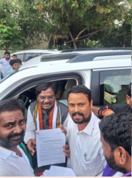
చోటుచేసుకుంటున్నాయని ఆయన ఆవేదన వ్యక్తం చేశారు.

అలాగే 2019, 2021, 2023 సంవత్సరాల తనిఖీలలో యంత్రాలకు భద్రత గార్లు లేవని స్పష్టంగా గుర్తించినప్పటికీ యాజమాన్యం ఎలాంటి చర్యలు తీసుకోలేదని, ప్రమాదకర రవాణానూ ఉపయోగించే ఫ్యాక్టరీలో హాజర్ అనాలిసిస్ నివేదికలు లేకపోవడం అత్యంత ఆందోళనకరమని అన్నారు. ప్రతి ఏడాది తనిఖీల్లో లోపాలు బయటపడుతున్నప్పటికీ సంబంధిత అధికారులు కఠిన చర్యలు తీసుకోకపోవడం వల్లే ఇటువంటి విషాద ఘటనలు