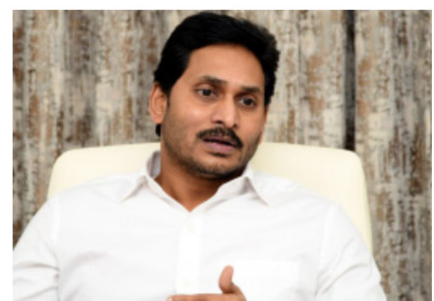
అందించాలని సూచించారు. ఘటనా స్థలంలో సహాయక చర్యలు వేగవంతం చేయాలని, గాయపడిన వారికి మెరుగైన వైద్యం అందేలా చూడాలని పార్టీ శ్రేణులకు, అధికారులకు విజ్ఞప్తి చేశారు.

శ్రీ సత్యసాయి జిల్లా ఏప్రిల్ 14: శ్రీ సత్యసాయి జిల్లా కదిరి మండలం కుమరవండ్లపల్లిలో జరిగిన ఘోర ప్రమాదంపై వైసీపీ అధినేత జగన్ తీవ్ర దిగ్భ్రాంతి వ్యక్తం చేశారు. జిలెటిన్ స్టిక్స్, గ్యాస్ సిలిండర్లు పేలిన ఘటనలో ఐదుగురు ప్రాణాలు కోల్పోవడం మనసుని కలచివేసిందని అన్నారు. ఈ ప్రమాదంలో మరణించిన వారి కుటుంబాలకు తన ప్రగాఢ సానుభూతిని తెలియజేసిన జగన్... గాయపడిన వారు త్వరగా కోలుకోవాలని ఆకాంక్షించారు. బాధితుల్లో కొందరి పరిస్థితి విషయంగా ఉండటం ఆందోళన కలిగిస్తోందని, పేలుడు ధాటికి ఇళ్లు కూడా ధ్వంసమవడం దురదృష్టకరమని పేర్కొన్నారు. ఇలాంటి ఘటనలు పునరావృతం కాకుండా ఉండాలంటే పేలుడు పదార్థాల నిల్వపై ప్రభుత్వం కట్టుదిట్టమైన నిఘా ఉంచాలని, నిబంధనలు అతిక్రమించిన బాధ్యులపై కఠిన చర్యలు తీసుకోవాలని ఆయన సూచించారు. ఈ కష్ట సమయంలో బాధిత కుటుంబాలకు ప్రభుత్వం అండగా నిలబడి, తగిన ఆర్థిక సహాయం