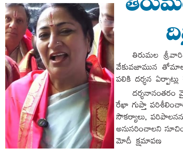
తిరుమల శ్రీవారిని దర్శించుకున్న దిల్లీ సీఎం రేఖా గుప్తా తిరుమల శ్రీవారిని దిల్లీ ముఖ్యమంత్రి రేఖా గుప్తా దర్శించుకున్నారు. బుధవారం వేకువజామున తోమలాసేపలో ఆమె పాల్గొన్నారు. తిదిదే అధికారులు ఆమెకు స్వాగతం పలికి దర్శనం ఏర్పాటు చేశారు. దర్శనానంతరం వైకుంఠ క్యూ కాంప్లెక్స్ లోని ఇంటిగ్రేటెడ్ కమాండ్ కంట్రోల్ సెంటర్ ను రేఖా గుప్తా పరిశీలించారు. అనంతరం మీడియాతో మాట్లాడిన ఆమె.. తిరుమలలో కల్పిస్తున్న సౌకర్యాలు, పరిపాలనను ప్రశంసించారు. దేశంలోని ఇతర అలయాలు కూడా ఇదే విధానాన్ని అనుసరించాలని సూచించారు. ఈ వార్త చదివారా: ఎస్పీజీ భద్రతను దాటి వెళ్లి పధావరాలకు మోడి క్షమాపణ