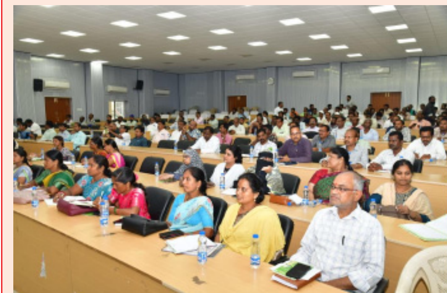
ప్రతి డీలర్ తప్పనిసరిగా ప్రభుత్వ విత్తనాభివృద్ధి సంస్థ విత్తనాలను తన దుకాణంలో ఉంచాలని, రైతులకు వాటిని ప్రోత్సహించాలని న్నవ్వం చేశారు. కరీంనగర్ జిల్లాలో సాగు అంచనాలను వివరించారు.

సహకార సంఘాలు, ఏఆర్ఎస్ కే కేంద్రాల తీరుపై అసహనం వ్యక్తం చేశారు. కేవలం రాయితీపై ఇచ్చే విత్తనాల విక్రయానికే పరిమితం కాకుండా, ప్రభుత్వం సేకరించిన అన్ని రకాల విత్తనాలను విక్రయించాలని ఆదేశించారు. లైసెన్స్ ఉన్న