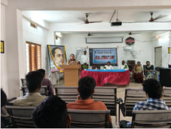
రాజ్యాంగాన్ని రూపొందించి సమానత్వం, స్వేచ్ఛ, న్యాయం, అనే