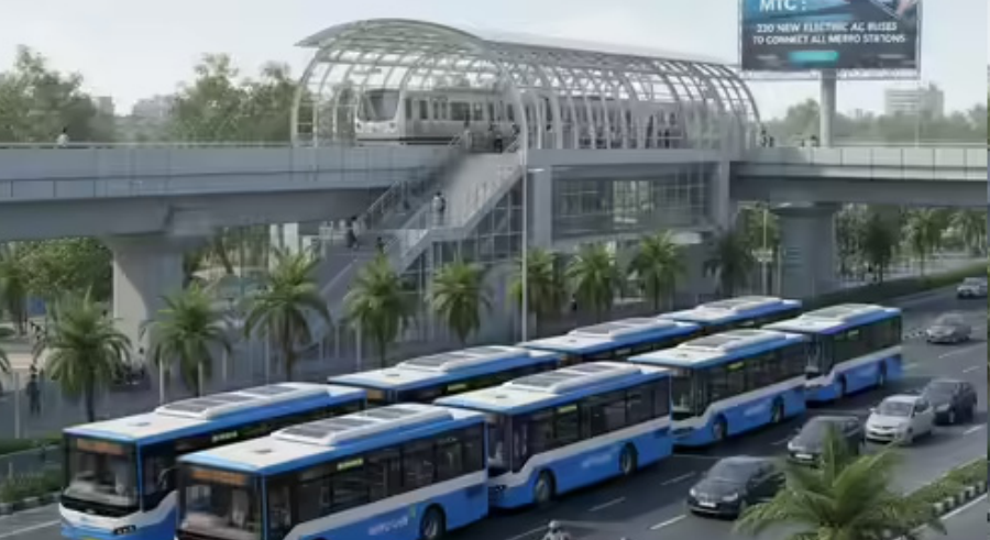
అవకాశం ఉన్న నేపథ్యంలో ఈ కేంద్రాలతో ఆ ఇబ్బంది తొలిగిపోనుంది. ఆర్టీసీ బస్సు డిపోకు తిరిగివచ్చిన తర్వాత పూర్తిగా ఛార్జ్ చేయాలైన అవసరం తగ్గుతుంది. టెర్మినల్లో 10 నుంచి 15 నిమిషాల లేటవరల్లో టాప్ అప్ చేసుకొని మళ్లీ ఆయా రూట్ లోకి వెళ్తారు. దీని వల్ల బస్సులను ఎక్కువ శ్రీష్టులు తిప్పటానికి అవకాశం ఉండటంతో పాటు సుదూర మార్గాల్లో ప్రయాణ సేవలు అందించొచ్చు.

మినీ ఎలక్ట్రిక్ బస్సులను ఉపయోగించాలని ఆర్టీసీ నిర్ణయించింది. మెట్రో స్టేషన్ల సమీపం నుంచి ఈ మినీ ఎలక్ట్రిక్ బస్సులను సమీప కాలనీలకు నడపనున్నారు. ఈ మేరకు ఆర్టీసీ అధికారులు ప్రత్యేక చర్యలు తీసుకుంటున్నారు. త్వరలోనే ఈ ఎలక్ట్రిక్ బస్సులు రోడ్లెక్కనున్నాయి. ఇక గ్రేటర్ హైదరాబాద్ పరిధిలో పూర్తిగా ఎలక్ట్రిక్ బస్సులనే నడిపేందుకు ఆర్టీసీ చర్యలు తీసుకుంటోంది. ఈ మేరకు ఇంటర్మిటెంట్ ఛార్జింగ్ స్టేషన్ల ఏర్పాటుపై ఆర్టీసీ స్పెషల్ ఫోకస్ పెట్టింది. ప్రధాన టెర్మినల్ పాయింట్లు అయిన పటాన్ చెరు, ఆరాంఫర్, ఎల్వీనగర్, ఉప్పల్, వనస్థలివరం, గచ్చిబౌలి, కేపీ హెచ్ బీ కాలనీ, చిలకలగూడ, బాలానగర్, మెహదీపట్నం, గండిమైసమ్మ, సికింద్రాబాద్ రైల్వే స్టేషన్ ప్రాంతాల్లో ఈ ఛార్జింగ్ స్టేషన్లు అవసరమని తాజాగా ఆర్టీసీ అధికారులు గుర్తించారు. ఇందుకు 1500 నుంచి 2500 చదరపు మీటర్ల చొప్పున భూమి కావాలని ప్రభుత్వానికి ఇప్పటికే ప్రతిపాదనలు పంపింది. సూచించిన ఆయా ప్రాంతాల్లోని భూములను గుర్తించి జాబ్ లా ఇవ్వాలని రెవెన్యూ అధికారులను ఆర్టీసీ యాజమాన్యం కోరింది. ఎలక్ట్రిక్ బస్సులు నడుస్తున్న సమయంలో లేదా టెర్మినల్ వద్ద ఇంటర్మిటెంట్ ఛార్జింగ్ స్టేషన్లు 10 నుంచి 20 నిమిషాలు పాక్షికంగా బ్యాటరీని ఛార్జ్ చేస్తాయి. దీనినే అవర్చునీటి ఛార్జింగ్ అని అంటారు. బస్సు రూల్స్ వివరించే పాయింట్ లేదా మధ్యలోని ప్రధాన స్టాప్ వద్ద వీటిని అందుబాటులోకి తీసుకొస్తారు. ఆయా ప్రాంతాల్లో ఏర్పాటు చేసే 300 నుంచి 600 కిలోవాట్ల హై పవర్ ఛార్జర్లు ఎలక్ట్రిక్ బస్సులను త్వరగా ఛార్జ్ చేయనున్నాయి. వీటితో పాటు అన్ని బస్సులు ఒకేసారి రాత్రి డిపోలో ఛార్జ్ చేస్తే విద్యుత్ గ్రిడ్ పై భారం పెరిగే