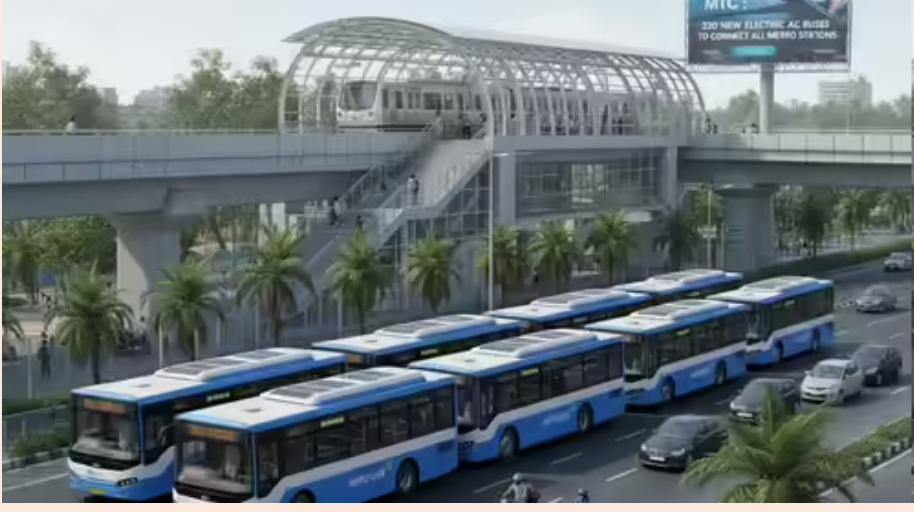
అవకాశం ఉన్న నేపథ్యంలో ఈ కేంద్రాలతో ఆ ఇబ్బంది తొలిగిపోనుంది. ఆర్టీసీ బస్సు డిపోకు తిరిగివచ్చిన తర్వాత పూర్తిగా ఛార్జ్ చేయాలైన అవసరం తగ్గుతుంది. టెర్మినల్లో 10 నుంచి 15 నిమిషాల లేటవరల్లో టాప్ అప్ చేసుకొని మళ్లీ ఆయా రూట్ లోకి వెళ్తారు. దీని వల్ల బస్సులను ఎక్కువ శ్రీష్టులు తిప్పటానికి అవకాశం ఉండటంతో పాటు సుదూర మార్గాల్లో ప్రయాణ సేవలు అందించొచ్చు.

మినీ ఎలక్ట్రిక్ బస్సులను ఉపయోగించాలని ఆర్టీసీ నిర్ణయించింది. మెట్రో స్టేషన్ల సమీపం నుంచి ఈ మినీ ఎలక్ట్రిక్ బస్సులను సమీప కాలనీలకు నడపనున్నారు. ఈ మేరకు ఆర్టీసీ అధికారులు ప్రత్యేక చర్యలు తీసుకుంటున్నారు. త్వరలోనే ఈ ఎలక్ట్రిక్ బస్సులు రోడ్లెక్కనున్నాయి. ఇక గ్రేటర్ హైదరాబాద్ పరిధిలో పూర్తిగా ఎలక్ట్రిక్ బస్సులనే నడిపేందుకు ఆర్టీసీ చర్యలు తీసుకుంటోంది. ఈ మేరకు ఇంటర్మిటెంట్ ఛార్జింగ్ స్టేషన్ల ఏర్పాటుపై ఆర్టీసీ స్పెషల్ ఫోకస్ పెట్టింది. ప్రధాన టెర్మినల్ పాయింట్లు అయిన పటాన్ చెరు, ఆరాంఫర్, ఎల్వీనగర్, ఉప్పల్, వనస్థలివరం, గచ్చిబౌలి, కేపీ హెచ్ బీ కాలనీ, చిలకలగూడ, బాలానగర్, మెహదీపట్నం, గండిమైసమ్మ, సికింద్రాబాద్ రైల్వే స్టేషన్ ప్రాంతాల్లో ఈ ఛార్జింగ్ స్టేషన్లు అవసరమని తాజాగా ఆర్టీసీ అధికారులు గుర్తించారు. ఇందుకు 1500 నుంచి 2500 చదరపు మీటర్ల చొప్పున భూమి కావాలని ప్రభుత్వానికి ఇప్పటికే ప్రతిపాదనలు పంపింది. సూచించిన ఆయా ప్రాంతాల్లోని భూములను గుర్తించి జాబితా ఇవ్వాలని రెవెన్యూ అధికారులను ఆర్టీసీ యాజమాన్యం కోరింది. ఎలక్ట్రిక్ బస్సులు నడుస్తున్న సమయంలో లేదా టెర్మినల్ వద్ద ఇంటర్మిటెంట్ ఛార్జింగ్ స్టేషన్లు 10 నుంచి 20 నిమిషాలు పాక్షికంగా బ్యాటరీని ఛార్జ్ చేస్తాయి. దీనినే అవర్చునీటి ఛార్జింగ్ అని అంటారు. బస్సు రూల్స్ వివరించే పాయింట్ లేదా మధ్యలోని ప్రధాన స్టాప్ల వద్ద వీటిని అందుబాటులోకి తీసుకొస్తారు. ఆయా ప్రాంతాల్లో ఏర్పాటు చేసే 300 నుంచి 600 కిలోవాట్ల హై పవర్ ఛార్జర్లు ఎలక్ట్రిక్ బస్సులను త్వరగా ఛార్జ్ చేయనున్నాయి. వీటితో పాటు అన్ని బస్సులు ఒకేసారి రాత్రి డిపోలో ఛార్జ్ చేస్తే విద్యుత్ గ్రిడ్ పై భారం పెరిగే