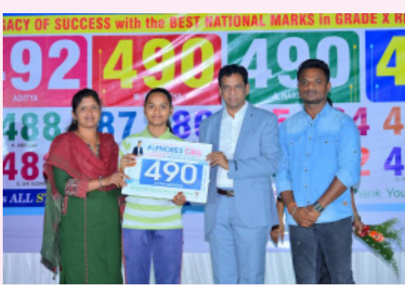
చెప్పారు. విద్యార్థులు వివిధ సబ్జెక్టులలో నూరు శాతం మార్కులు ప్రశంసనీయమైనవన్నారు. ప్రారంభించిన నాటినుండి అల్ఫోర్స్ సీబీఎస్ఈ పై చేయి సాధిస్తుందని, ఈ ఘన విజయాలను సాధించుటకై తోడ్పాటు అందిస్తున్న తల్లిదండ్రులకు, అపార్తితులు కృషి చేస్తున్నటువంటి సిబ్బందికి హృదయపూర్వక శుభాకాంక్షలు తెలిపారు.