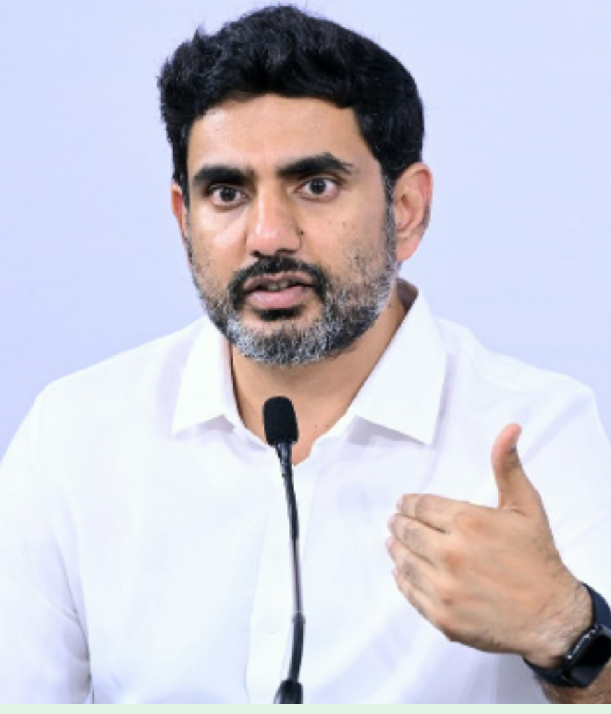
పంచాయితీరాజ్ మంత్రిగా పనిచేసిన కాలంలోనే లోకేష్ తన పాలనలోనూ సమర్థత చాటుకున్నారు. గ్రామాల్లో ఎల్.కె.డీ వీధి దీపాలు, సీసీ రోడ్ల నిర్మాణాలతో రికార్డు స్థాయి పనులుచేసారు. ఇప్పుడు స్పీడ్ ఆఫ్ డూయింగ్ బిజినెస్ పై ఆయన దృష్టి సాించారు. రోజువారీ ప్రభుత్వ సేవల్లో సరళత తీసుకురావడం ద్వారా పనిచేసే ప్రభుత్వం అని సమర్థం కలిగించే ప్రయత్నం చేస్తున్నారు. వాల్టాప్ సేవలు తీసుకురావడంలో జాతీయ స్థాయిలో ఏపీ ఆదర్శంగా నిలిచింది. దాంతోపాటు పెట్టుబడులు భారీగా ఆకర్షించాలనే తపన చూపుతున్నారు.

ముద్రచెట్టు నీడలో మరో చెట్టు ఎదగడం కష్టం. లోకేష్ తాత ఎన్టీఆర్ లాంటి ఆకర్షణ, చంద్రబాబు క్రమశిక్షణ, చాతుర్యం ముందు దిగదుడుపే. కానీ వారిని అందుకోవాలన్న ఆత్రంకన్నా తనదైన శైలిని ఏర్పరచుకోవాలనే పట్టుదల లోకేష్ లో కనిపిస్తుంది. చంద్రబాబు నాయుడు తర్వాత టీడీపీ భవిష్యత్తు ఏమిటన్న ప్రశ్నకు లోకేష్ తన పనితీరు సమాధానం అంటున్నారు. వర్కింగ్ ప్రెసిడెంట్ గా బాధ్యతలు చేపట్టడం కేవలం పదవి దక్కించుకోవడం కాదు లక్షలాది కార్యకర్తల ఆకాంక్షలను మోసే బాధ్యత.