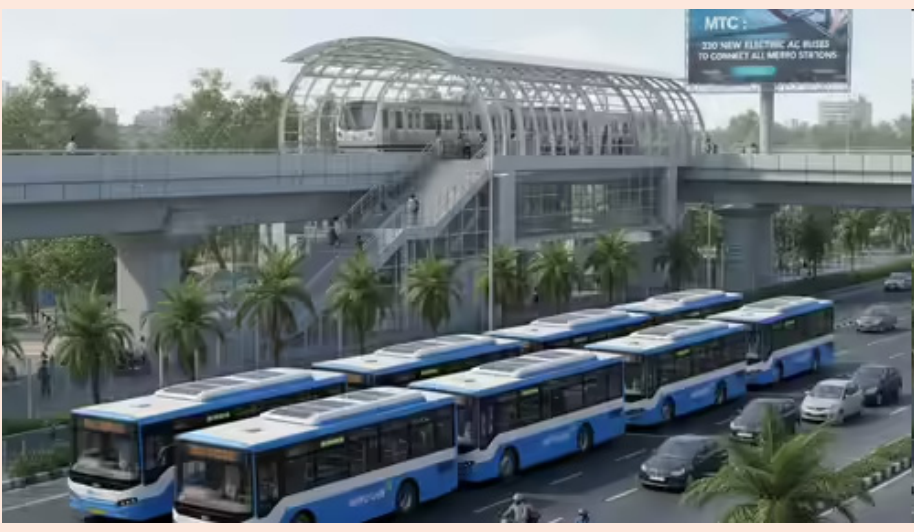
అవకాశం ఉన్న నేపథ్యంలో ఈ కేంద్రాల్లో ఆ ఇబ్బంది తొలిగిపోనుంది. ఆర్టీసీ బస్సు డిపోకు తిరిగిచ్చిన తర్వాత పూర్తిగా ఛార్జ్ చేయాలైన అవసరం తగ్గుతుంది. టెర్మినల్లో 10 నుంచి 15 నిమిషాల లేటవరల్లోనే టాప్ అప్ చేసుకొని మళ్లీ ఆయా రూట్ లోకి వెళ్తారు. దీని వల్ల బస్సులను ఎక్కువ శ్రీష్టులు తిప్పటానికి అవకాశం ఉండటంతో పాటు సుదూర మార్గాల్లో ప్రయాణ సేవలు అందించొచ్చు.

మినీ ఎలక్ట్రిక్ బస్సులను ఉపయోగించాలని ఆర్టీసీ నిర్ణయించింది. మెట్రో స్టేషన్ల సమీపం నుంచి ఈ మినీ ఎలక్ట్రిక్ బస్సులను సమీప కాలనీలకు నడపనున్నారు. ఈ మేరకు ఆర్టీసీ అధికారులు ప్రత్యేక చర్యలు తీసుకుంటున్నారు. త్వరలోనే ఈ ఎలక్ట్రిక్ బస్సులు రోడ్లెక్కనున్నాయి. ఇక గ్రేటర్ హైదరాబాద్ పరిధిలో పూర్తిగా ఎలక్ట్రిక్ బస్సులనే నడిపేందుకు ఆర్టీసీ చర్యలు తీసుకుంటోంది. ఈ మేరకు ఇంటర్మిటెంట్ ఛార్జింగ్ స్టేషన్ల ఏర్పాటుపై ఆర్టీసీ స్పెషల్ ఫోకస్ పెట్టింది. ప్రధాన టెర్మినల్ పాయింట్లు అయిన పటాన్ చెరు, ఆరాంపూర్, ఎల్వీనగర్, ఉప్పల్, వనస్థలిపురం, గచ్చిబౌలి, కేపీ హెచ్ బీ కాలనీ, చిలకలగూడ, బాలానగర్, మెహదీపట్నం, గండిమైసమ్మ, సికింద్రాబాద్ రైల్వే స్టేషన్ ప్రాంతాల్లో ఈ ఛార్జింగ్ స్టేషన్లు అవసరమని తాజాగా ఆర్టీసీ అధికారులు గుర్తించారు. ఇందుకు 1500 నుంచి 2500 చదరపు మీటర్ల చొప్పున భూమి కావాలని ప్రభుత్వానికి ఇప్పటికే ప్రతిపాదనలు పంపింది. సూచించిన ఆయా ప్రాంతాల్లోని భూములను గుర్తించి జాబితా ఇవ్వాలని రెవెన్యూ అధికారులను ఆర్టీసీ యాజమాన్యం కోరింది. ఎలక్ట్రిక్ బస్సులు నడుస్తున్న సమయంలో లేదా టెర్మినల్ వద్ద ఇంటర్మిటెంట్ ఛార్జింగ్ స్టేషన్లు 10 నుంచి 20 నిమిషాలు పాక్షికంగా బ్యాటరీని ఛార్జ్ చేస్తాయి. దీనినే అవర్చునీటి ఛార్జింగ్ అని అంటారు. బస్సు రూల్స్ వివరించే పాయింట్ లేదా మధ్యలోని ప్రధాన స్టాప్ల వద్ద వీటిని అందుబాటులోకి తీసుకొస్తారు. ఆయా ప్రాంతాల్లో ఏర్పాటు చేసే 300 నుంచి 600 కిలోవాట్ల హై పవర్ ఛార్జర్లు ఎలక్ట్రిక్ బస్సులను త్వరగా ఛార్జ్ చేయనున్నాయి. వీటితో పాటు అన్ని బస్సులు ఒకేసారి రాత్రి డిపోలో ఛార్జ్ చేస్తే విద్యుత్ గ్రిడ్ పై భారం పెరిగే