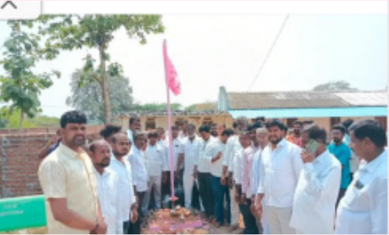
మెదక్ జిల్లా, ఏప్రిల్ 27(భారత శక్తి న్యూస్):

మెదక్ జిల్లా కౌడిపల్లి మండల పరిధిలోని తునికి గ్రామంలో బిఆర్ఎస్ పార్టీ ఆవిర్భవ దినోత్సవం సందర్భంగా సోమవారం నాడు జెండా ఆవిష్కరణ చేయడానికి వెళ్ళగా అపశృతి చోటుచేసుకుంది. గుర్తుతెలియని వ్యక్తులు బీ ఆర్ఎస్ పార్టీ గడ్డెను కూల్చివేయడం జరిగింది. దీంతో తునికి గ్రామంలో తీవ్ర ఉద్రిక్తత వాతావరణం నెలకొంది. బిఆర్ఎస్ పార్టీ గడ్డెను