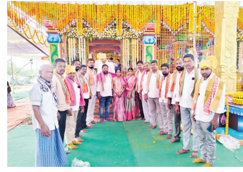
బీరప్ప దయవలన విష్యమంత బాగుండాలని కోరుకున్నమని అన్నారు. సకాలంలో వర్షాలు పడి

పాడి పంటలు సమృద్ధిగా ఉండే ప్రజలందరూ సుఖంతోపాటు ఉండాలని, అలాగే ఈ పండుగను తిలకించడానికి వచ్చిన భక్తులకు, అలాగే గ్రామ ప్రజలపై మా కుల దేవుడు శ్రీ బీరప్ప ఆశీర్వాదం ఉండాలని ఆకాంక్షించారు. ఈ కార్యక్రమంలో కుకునూర్ పల్లి కురుమ సంఘం నాయకులు, గ్రామ ప్రజలు, యువకులు, మహిళలు, చిన్నారులు, పలు గ్రామాల సర్పంచులు, మాజీ సర్పంచులు, ఎంపీటీసీలు, మాజీ ఎంపీటీసీలు, నాయకులు తదితరులు పాల్గొన్నారు.