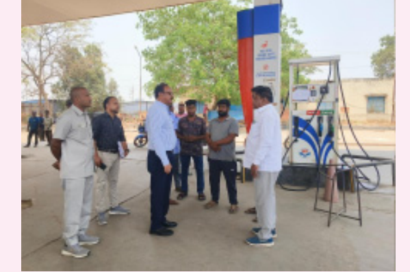
జరుగుతుందని జిల్లా కలెక్టర్ హెచ్చరించారు.