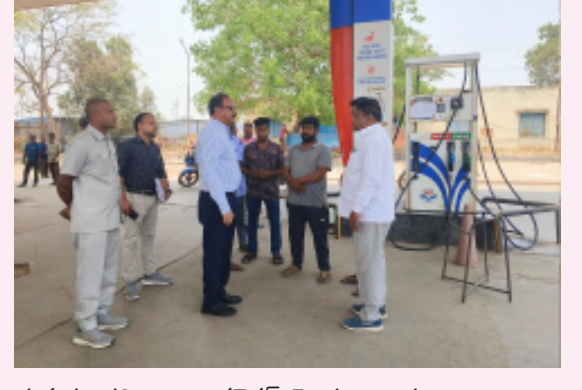
జరుగుతుందని జిల్లా కలెక్టర్ హెచ్చరించారు.