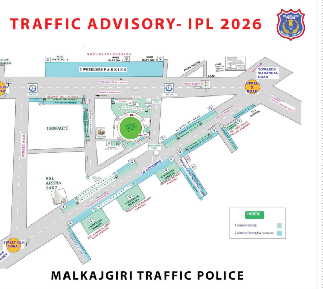
MALKAJGIRI TRAFFIC POLICE