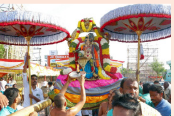
ఏప్రిల్ 4న చక్రస్నానం శ్రీ కోదండరామస్వామివారి బ్రహ్మోత్సవాల్లో భాగంగా శనివారం ఉదయం 10.30 నుండి 11.15 గంటల వరకు చక్రస్నానం వైభవంగా జరుగుతుంది. అదే రోజు రాత్రి 7 గంటలకు ధ్వజావరోహణంతో బ్రహ్మోత్సవాలు ముగియనున్నాయి. ఏప్రిల్ 5న పుష్యయాగం ఆదివారం సాయంత్రం 6 నుండి రాత్రి 9 గంటల వరకు ఆలయంలో పుష్యయాగం వైభవంగా నిర్వహించనున్నారు.

కడప, భారత శక్తి ప్రతినిధి, ఏప్రిల్ 03: ఒంటిమిట్టలోని శ్రీ కోదండరామస్వామివారి శ్రీరామనవమి బ్రహ్మోత్సవాల్లో భాగంగా 8వ రోజైన శుక్రవారం ఉదయం స్వామివారు కాళీయమర్దన అలంకారంలో భక్తులను కటాక్షించారు. ఉదయం 7.30 నుండి 9.30 గంటల వరకు జరిగిన వాహన సేవలో భజన బృందాలు భక్తిరసభరితంగా భజనలు, కోలాటాలు నిర్వహించగా, స్వామివారు పురవీధుల్లో విహరిస్తూ భక్తులను ఆనందింపజేశారు.