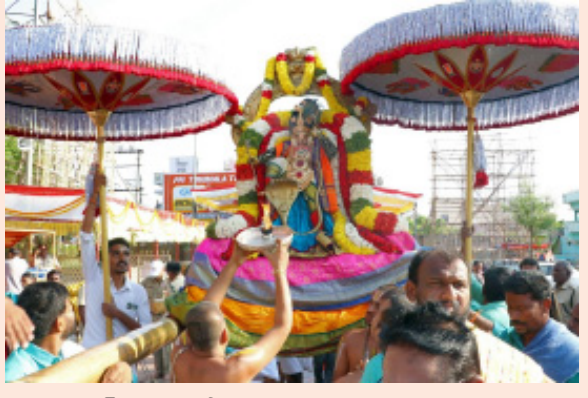
ఏప్రిల్ 4న చక్రస్నానం శ్రీ కోదండరామస్వామివారి బ్రహ్మోత్సవాల్లో భాగంగా శనివారం ఉదయం 10.30 నుండి 11.15 గంటల వరకు చక్రస్నానం వైభవంగా జరుగుతుంది. అదే రోజు రాత్రి 7 గంటలకు ధ్వజావరోహణంతో బ్రహ్మోత్సవాలు ముగియనున్నాయి. ఏప్రిల్ 5న పుష్యయాగం ఆదివారం సాయంత్రం 6 నుండి రాత్రి 9 గంటల వరకు ఆలయంలో పుష్యయాగం వైభవంగా నిర్వహించనున్నారు.

కడప, భారత శక్తి ప్రతినిధి, ఏప్రిల్ 03: ఒంటిమిట్టలోని శ్రీ కోదండరామస్వామివారి శ్రీరామనవమి బ్రహ్మోత్సవాల్లో భాగంగా 8వ రోజైన శుక్రవారం ఉదయం స్వామివారు కాళీయమర్దన అలంకారంలో భక్తులను కటాక్షించారు. ఉదయం 7.30 నుండి 9.30 గంటల వరకు జరిగిన వాహన సేవలో భజన బృందాలు భక్తిరసభరితంగా భజనలు, కోలాటాలు నిర్వహించగా, స్వామివారు పురవీధుల్లో విహరిస్తూ భక్తులను ఆనందింపజేశారు.