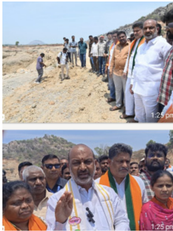
ఎన్నికల్లో ముఖ్యమంత్రి రేవంత్ రెడ్డి చెప్పిన అబద్ధాలకు విసిగిపోయి కాంగ్రెస్ ను ఓడించారు. కేరళం రేవంత్ రెడ్డి వెళ్లింది కాంగ్రెస్ పెద్దలకు మూటలు అప్పగించడానికే, రేవంత్ రెడ్డి చెబుతున్న అబద్ధాలే కేరళంలో కాంగ్రెస్ ను ఓడించబోతోంది. కేరళ ప్రజలతోపాటు మీడియాకు అప్పీల్ చేస్తున్నా. ఒక్కసారి తెలంగాణకు రండి. 6 గ్యారంటీల అమలుపై క్షేత్ర స్థాయిలో ప్రజాభిప్రాయ సేకరణ చేయడం అవసరం.

హుజూరాబాద్ ఏప్రిల్ 5, హుజూరాబాద్ లోని సిర్సపల్లి, రంగాపూర్ సమీపంలోని డంపింగ్ యార్డ్ ప్రతిపాదిత స్థలాన్ని కేంద్ర మంత్రి బండి సంజయ్ శనివారం పరిశీలించారు. తరువాత మీడియాతో మాట్లాడుతూ హాట్ కామెంట్స్ చేశారు. బండి సంజయ్ మాట్లాడుతూ హుజూరాబాద్ లో డంపింగ్ యార్డ్ ఏర్పాటును వ్యతిరేకిస్తున్నాం. జనావాసాల మధ్యలో డంపింగ్ యార్డ్ ను ఏర్పాటు చేయడం సరికాదు? ప్రజలతోపాటు వన్యప్రాణులకు హాని కలిగించే నిర్ణయమిది. గత పాలకులు ప్రతిపాదిస్తే కాంగ్రెస్ ప్రభుత్వం డంపింగ్ యార్డ్ ను ఏర్పాటు చేస్తోంది. హుజూరాబాద్ ప్రజల ఆందోళనకు బీజేపీ వక్షాన సంపూర్ణ మద్దతిస్తున్నాం. తక్షణమే హుజూరాబాద్ లో డంపింగ్ యార్డ్ ఏర్పాటు నిర్ణయాన్ని ఉపసంహరించుకోవాలి. లేనిపక్షంలో హుజూరాబాద్ ప్రజలతో కలిసి పెద్ద ఎత్తున బీజేపీ ఉధ్యమిస్తుంది సీఎంకె చిత్తశుద్ధి ఉంటే, డంపింగ్ యార్డ్ ఏర్పాటు స్థలాన్ని పరిశీలించాలి. తెలంగాణలో 6 గ్యారంటీలను అమలు చేశామని సీఎం చెప్పడం పచ్చి అబద్ధం. ఆరు గ్యారంటీల అమలుపైనా ముఖ్యమంత్రికి సవాల్ విసరుతున్నా. కేరళం మీడియాను తీసుకుని తెలంగాణలో పర్యటిద్దాం. తెలంగాణలో 6 గ్యారంటీలను అమలు చేసినట్లు నిరూపిస్తే నేను మంత్రి పదవికి రాజీనామా చేసేందుకు సిద్ధమని అన్నారు. మహిళలకు రూ.2500లు, తులం బంగారం, సూట్, రూ.4 వేల ఆసరా పెన్సిల్లు, విద్యార్థులకు రూ.5 లక్షల భరోసా కార్డు, నిరుద్యోగులకు రూ.4 వేల గ్రూప్, కౌలు రైతులు, రైతు కూలీలకు రైతు భరోసా అమలు చేయలేదని నేను నిరూపిస్తా. రేవంత్ రెడ్డి ముఖ్యమంత్రి పదవికి రాజీనామా చేసేందుకు సిద్ధమా అని నిలదీసారు. మోడీ చేసిన అభివృద్ధి పనులతోపాటు బీహార్, ఢిల్లీ