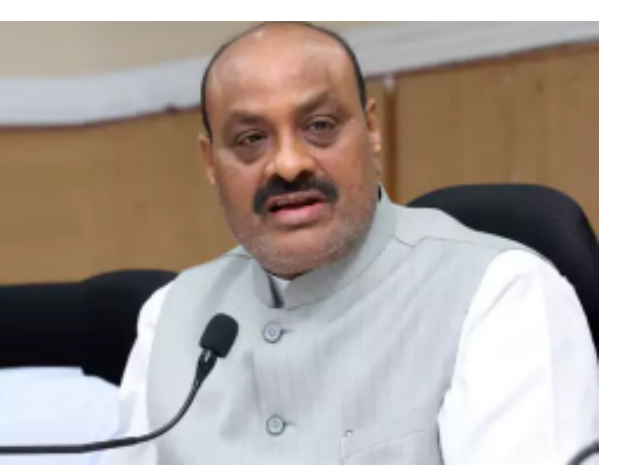
జనార్దన్ రెడ్డి తెలిపారు. ప్రాంతాల మధ్య విద్యోగాలు రెచ్చగొట్టేలా జగన్ వ్యవహరిస్తున్నారని ఆరోపించారు.

టెక్నాలజీ: శ్రీకాకుళం జిల్లా వాసుల చిరకాల కోరిక మూలపేట గ్రీన్ ఫీల్డ్ పోర్టుతో తీరనుందని మంత్రి కింజరాపు అచ్చెన్నాయుడు అన్నారు. మూలపేట పోర్టు నిర్మాణ పనులను మంత్రి బీసీ జనార్దన్ రెడ్డితో కలిసి సోమవారం ఆయన పరిశీలించారు. అనంతరం పనుల పురోగతిపై అధికారులు, నిర్మాణ సంస్థ ప్రతినిధులతో సమీక్షించారు. ఈ ఏడాది చివరి నాటికి పోర్టును పూర్తి చేయాలని నిర్మాణ సంస్థల్ని ఆదేశించారు. గత వైకాపా పాలనలో మూలపేట పోర్టులో కొన్ని పనులు ప్రారంభం కాలేదని అన్నారు. శంకుస్థాపన చేస్తే పనులు జరిగినట్లు అని వ్యాఖ్యానించారు. రైల్వే లైన్, రోడ్డు నిర్మాణ పనులు జరగకపోవడంతో.. అనుకున్న సమయం కంటే పోర్టు నిర్మాణ పనులు ఆలస్యంగా జరుగుతున్నాయని చెప్పారు. దాదాపు 74 శాతం పనులు పూర్తయ్యాయని మంత్రి