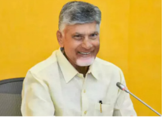
అలమరావతి: భాజపా ఆవిర్భావ దినోత్సవం సందర్భంగా ఆ పార్టీ నాయకులు, కార్యకర్తలకు సీఎం చంద్రబాబు శుభాకాంక్షలు తెలిపారు.

తెలిపారు. దేశ సమగ్రాభివృద్ధికి కట్టుబడి ఉన్న పార్టీ భాజపా అని కొనియాడారు. మన సంస్కృతి, ప్రజాస్వామ్య విలువలను ఆ పార్టీ బలోపేతం చేస్తోందన్నారు. రాష్ట్రంలో డబల్ ఇంజన్ సర్కారు వేగంగా ప్రజలకు సేవలందిస్తోందని తెలిపారు. వికసిత భారత్ లక్ష్య సాధనలో భాజపా మరిన్ని విజయాలు సాధించాలని ఆకాంక్షించారు.