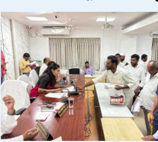
అందినట్లు తెలిపారు.ఈ కార్యక్రమంలో వివిధ శాఖల జిల్లా అధికారులు, రెవెన్యూ డివిజన్ అధికారులు, మున్సిపల్ కమిషనర్లు,ఇతర సంబంధిత అధికారులు, ప్రజలు పాల్గొన్నారు.