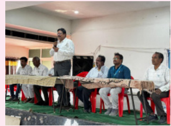
తీసుకోవాలి. బహిరంగ ప్రదేశాల్లో అమ్మే అస్వచ్ఛమైన ఆహారాన్ని నివారించాలి. నిల్వ ఉంచిన ఆహారాన్ని సరైన విధంగా భద్రపరచాలి.