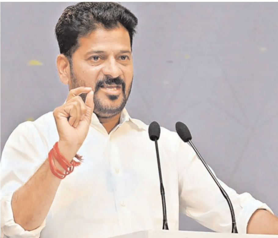
నియమించుకుంటున్నారు.. “మలయాళ ప్రజలకు సమస్యారం.. కాంగ్రెస్ పార్టీ అభ్యర్థులకు ఓటు వేయండి. కేరళ రాష్ట్రంలో అభివృద్ధి అంటే ఏంట్లో కాంగ్రెస్ పార్టీ చూపించింది. కాంగ్రెస్ పార్టీ బలపరచిన అభ్యర్థులకు ఓటు వేసి.. ప్రజాస్వామ్యాన్ని

హైదరాబాద్, ఏప్రిల్ 6, (రేవంత్ రెడ్డి తెలంగాణ ముఖ్యమంత్రిగా కొనసాగుతున్నారు. ముఖ్యమంత్రిగా ఎన్నికైన తొలి రోజుల్లో కాస్త ఇబ్బంది పడ్డారు. ఆ తర్వాత పరిపాలన మీద పట్టు సాధించడం మొదలుపెట్టారు. మంత్రుల మీద కూడా తన మార్క్ పెత్తనం ప్రదర్శిస్తున్నారు. అధిష్టానం ఎదుట మంచి మార్కులు సాధించుకొని.. గట్టి లీడర్ గా ఎదిగారు. కర్ణాటక.. ఇంకా కొన్ని ప్రాంతాలలో అధికారంలో ఉన్నప్పటికీ.. ఆర్థిక పరిపుష్టి ఉన్న నాయకుడు కావడంతో అధిష్టానం రేవంత్ రెడ్డికి కేరళ బాధ్యతలు అప్పగించింది. దేశంలో ప్రస్తుతం ఐదు రాష్ట్రాలకు ఎన్నికలు జరుగుతున్నాయి. ఇందులో కేరళ కూడా ఉంది. కేరళ రాష్ట్రంలో కాంగ్రెస్ తరపున ప్రచారం చేస్తున్నారే రేవంత్ రెడ్డి. తెలంగాణ రాష్ట్రాన్ని చెందిన ఇతర ముఖ్య నేతలు కూడా ప్రస్తుతం కేరళలోనే మకాం వేశారు. కాంగ్రెస్ పార్టీలో సీనియర్ నాయకులు.. షైర్ బ్రాండ్ లీడర్లు.. గట్టి స్వరం ఉన్న నాయకులు కేరళ రాష్ట్రంలో విస్తృతంగా ప్రచారం చేస్తున్నారు. ప్రచారం చేస్తున్న వారిలో దుద్దిల్ల శ్రీధర్ బాబు, పొంగులేటి శ్రీనివాస్ రెడ్డి కూడా ఉన్నారు. తన రాజకీయ జీవితంలో తొలిసారి కేరళ రాష్ట్రంలో ఎన్నికల ప్రచారం చేస్తున్న రేవంత్ రెడ్డి.. కేరళ రాష్ట్రంలో అనేక ప్రాంతాలలో నిర్వహిస్తున్న రోడ్డు షోలలో పాల్గొన్నారు. అక్కడ పోటీ చేస్తున్న కాంగ్రెస్ పార్టీ అభ్యర్థుల తరపున ఆయన విస్తృతంగా ప్రచారం చేస్తున్నారే రాష్ట్రంలో అధికార భాషగా మలయాళం ఉంది. దక్షిణ భారతదేశంలో మలయాళం అనేది అత్యంత క్లిష్టమైన భాష. అందువల్లే రేవంత్ ఎన్నికల ప్రచారం చేస్తున్న సమయంలో.. ఒక అనువాదకుడిని