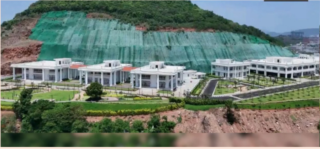
విశాఖపట్టణం ఏప్రిల్ 8,

రుషికొండ భవనాల అభివృద్ధి త్వరలో మారబోతోంది. ఈ ప్యాలెస్ ను ఏ విధంగా ఉపయోగించుకోవాలనే అంశంపై కేబినెట్ సబ్ కమిటీ కనబరచిన ముగింపు. ముఖ్యమంత్రి నారా చంద్రబాబు నాయుడు ఆదేశాల మేరకు, ఈ భవనాలను ప్రజాధనానికి భారంగా కాకుండా, ప్రభుత్వానికి ఆదాయం తెచ్చే వనరుగా మార్చేందుకు ప్రభుత్వం సిద్ధమైంది. ఈ నెల 10న జరగనున్న రాష్ట్ర కేబినెట్ సమావేశంలో దీనిపై తుది నిర్ణయం తీసుకుని, అధికారిక ప్రకటన చేసే అవకాశం ఉంది. గతంలో రుషికొండపై ఉన్న హరిత రిసార్ట్స్ ద్వారా ప్రభుత్వానికి ఏడాదికి సుమారు 7 కోట్ల రూపాయల ఆదాయం వచ్చేది. కానీ ప్రస్తుతం నిర్మించిన ప్యాలెస్ నిర్వహణకే నెలకు 25 లక్షల రూపాయల వరకు ఖర్చవుతోంది. విద్యుత్ ఛార్జీలు, ఇతర నిర్వహణ ఖర్చులు కలిపి ఏడాదికి 3 కోట్లకు పైగా ప్రజాధనం ఖర్చవుతుండటంతో, ప్రభుత్వం దీనిని ప్రోవర్ట్ యుటిలైజేషన్ చేయాలని నిర్ణయించింది. ప్రజల అభివృద్ధిని గౌరవిస్తూ, సుమారు 1517 మంది నుంచి సేకరించిన నూచనల ఆధారంగా