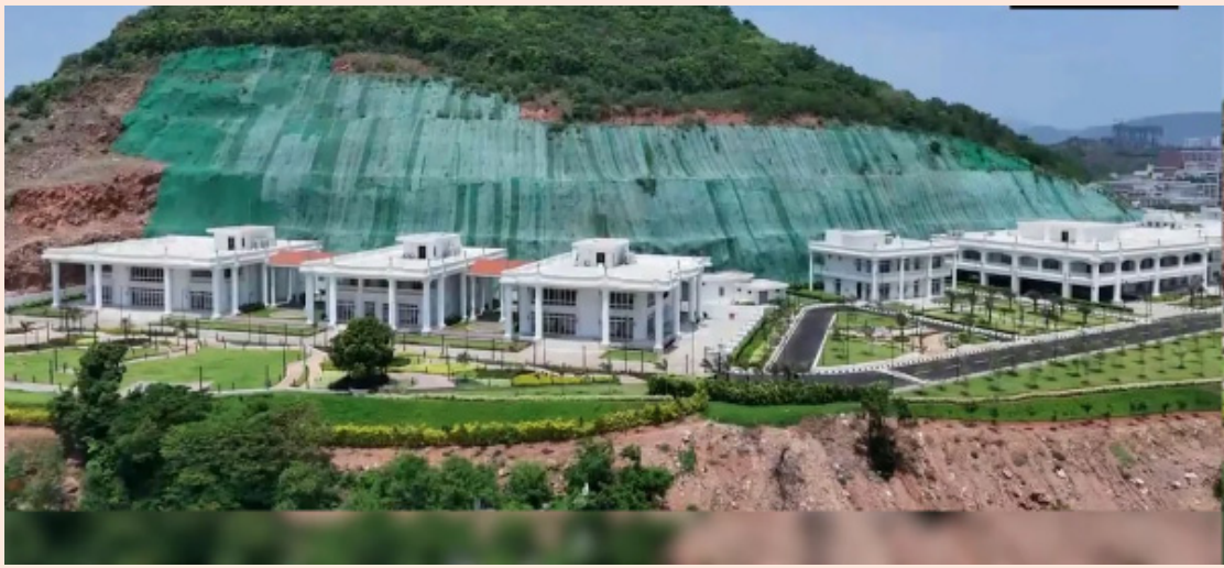
విశాఖపట్టణం ఏప్రిల్ 8,

రుషికొండ భవనాల అభివృద్ధి త్వరలో మారబోతోంది. ఈ ప్యాలెస్ ను ఏ విధంగా ఉపయోగించుకోవాలనే అంశంపై కేబినెట్ సబ్ కమిటీ కనబరచిన ముగింపు. ముఖ్యమంత్రి నారా చంద్రబాబు నాయుడు ఆదేశాల మేరకు, ఈ భవనాలను ప్రజాభివృద్ధికి భారంగా కాకుండా, ప్రభుత్వానికి ఆదాయం తెచ్చే వరకుగా మార్చేందుకు ప్రభుత్వం సిద్ధమైంది. ఈ నెల 10న జరగనున్న రాష్ట్ర కేబినెట్ సమావేశంలో దీనిపై తుది నిర్ణయం తీసుకుని, అధికారిక ప్రకటన చేసే అవకాశం ఉంది. గతంలో రుషికొండపై ఉన్న హరిత రిసార్ట్స్ ద్వారా ప్రభుత్వానికి ఏడాదికి సుమారు 7 కోట్ల రూపాయల ఆదాయం వచ్చేది. కానీ ప్రస్తుతం నిర్మించిన ప్యాలెస్ నిర్వహణకే నెలకు 25 లక్షల రూపాయల వరకు ఖర్చవుతోంది. విద్యుత్ ఛార్జీలు, ఇతర నిర్వహణ ఖర్చులు కలిపి ఏడాదికి 3 కోట్లకు పైగా ప్రజాధనం ఖర్చవుతుండటంతో, ప్రభుత్వం దీనిని ప్రైవేట్ యుటిలైజేషన్ చేయాలని నిర్ణయించింది. ప్రజల అభివృద్ధిని గౌరవిస్తూ, సుమారు 1517 మంది నుంచి సేకరించిన నూచనల ఆధారంగా