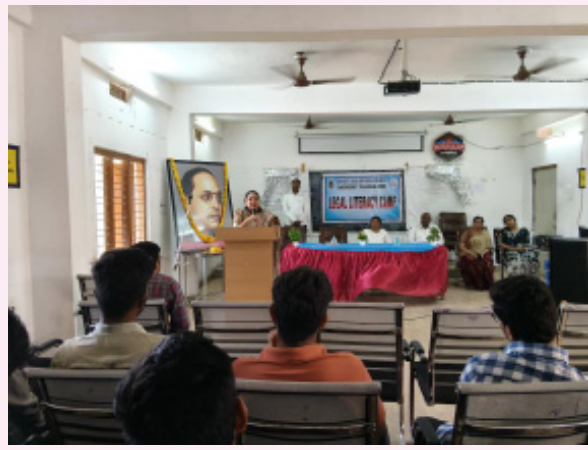
రాజ్యాంగాన్ని రూపొందించి సమానత్వం, స్వేచ్ఛ, న్యాయం, అనే