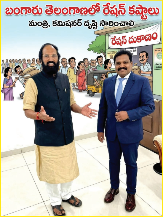
బంగారు తెలంగాణలో రేషన్ కష్టాలు మంత్రి, కమిషనర్ దృష్టి సారించాలి