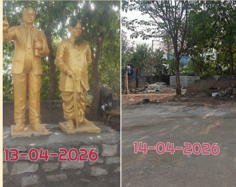
అధికారులు తీసుకున్న ఈ చర్యపై స్థానికులు తీవ్ర ఆగ్రహం వ్యక్తం చేస్తూ "రాజ్యాంగ నిర్మాత అంబేద్కర్, బాబు జగ్జీవన్ రామ్ విగ్రహాలకు అనుమతి అవసరమా?" అంటూ ప్రశ్నించారు. స్థానిక సంఘాల నాయకులు నిరసన తెలిపారు.