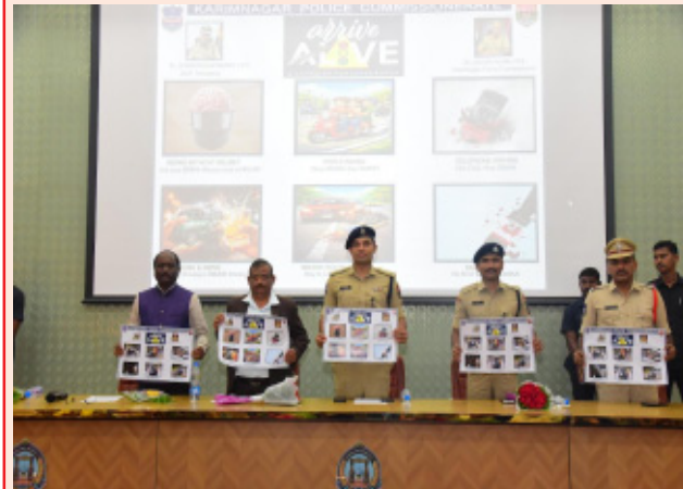
రోజు కార్యక్రమానికి జిల్లా పోలీస్ కమిషనర్ గౌస్ ఆలం హాజరయ్యారు.

తెలంగాణ ప్రభుత్వం ప్రతిష్టాత్మకంగా చేపట్టిన 99 రోజుల 'ప్రజా పాలన ప్రగతి ప్రణాళిక'లో భాగంగా బుధవారం కరీంనగర్ జిల్లా పోలీస్ శాఖ ఆధ్వర్యంలో శాతవాహన యూనివర్సిటీలో 'అరైవ్ అరైవ్' రోడ్డు భద్రతా అవగాహన కార్యక్రమాన్ని నిర్వహించారు. రెవెన్యూ, మున్సిపల్, రవాణా శాఖల సమన్వయంతో నిర్వహిస్తున్న రోడ్డు భద్రతా వారోత్సవాల 3వ