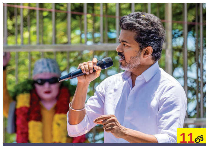
డిలిమిటేషన్ పై తన వైఖరి వెల్లడించిన విజయ్