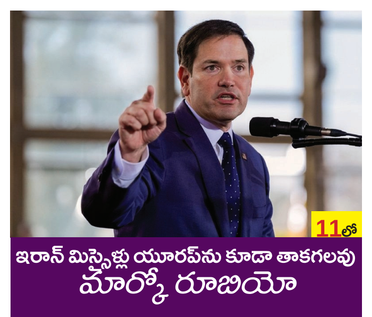
11లో ఇరాన్ మిస్సిళ్లు యూరప్ ను కూడా తాకగలవు మార్కెట్ రూబియో

Published from Hyderabad, Kadapa, Guntur, Kurnool, Khammam, Vijayawada & Warangal