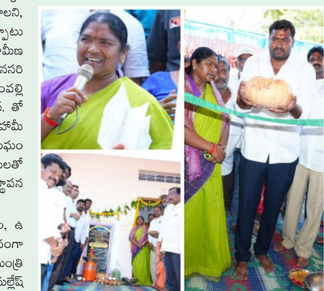
'అక్షరమాల' కార్యక్రమంలో భాగంగా రాష్ట్రంలో 7 లక్షల మంది మహిళలు చదువుకోవడం గర్వకారణమని, ములుగు జిల్లా నుంచి పరీక్ష రాసిన మహిళలను అభినందించారు.

ఈ నెల 14న ఫలితాలు రాగానే ఉత్తీర్ణులైన వారిని సత్కరించి బహుమతులు అందజేస్తామని పేర్కొన్నారు.