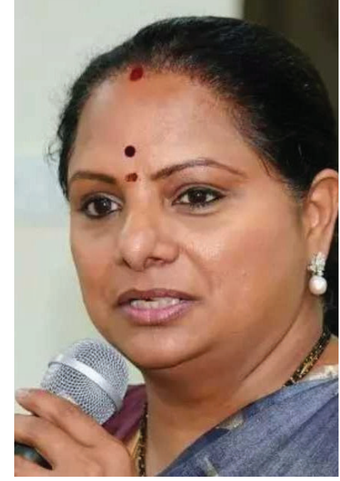
రావణుడు అని చెబుతున్నారని, కానీ శకుని ఎవరో చెప్పాలని ఎద్దేవా చేశారు. తాను

హైదరాబాద్, ఏప్రిల్ 01 (భారత శక్తి ప్రతినిధి): బీఆర్ఎస్ పార్టీ ఎమ్మెల్యేలు, మాజీ ప్రజాప్రతినిధులు తమతో టచ్ లో ఉన్నారని, సమయం వచ్చినప్పుడు అన్ని విషయాలు ప్రకటిస్తామని తెలంగాణ జాగృతి అధ్యక్షురాలు కల్పకుంట్ల కవిత తెలిపారు. హైదరాబాద్ లోని జాగృతి కార్యాలయంలో ఆమె మీడియాతో పిచ్చాపాటిగా మాట్లాడుతూ, అసెంబ్లీలో సమయం అంతా అధికార, ప్రతిపక్ష పార్టీలు పరస్పరం తిట్లు, విమర్శలు చేసుకోవడానికే సరిపోయిందని మండిపడ్డారు. ముఖ్యమంత్రి రేవంత్ రెడ్డి తాను శ్రీరాముడిని, కేసీఆర్