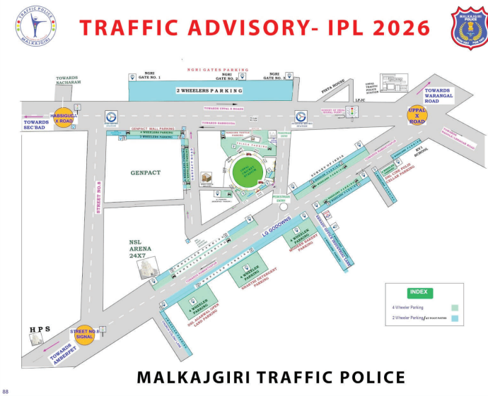
TRAFFIC ADVISORY- IPL 2026. MALKAJGIRI TRAFFIC POLICE