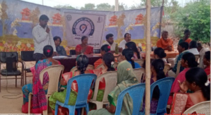
మరియు వార్డు సభ్యులు పాల్గొని గ్రామ ప్రజలకు సూచనలు చేశారు. గ్రామాభివృద్ధికి ప్రభుత్వం తీసుకుంటున్న చర్యలకు ప్రజలు మద్దతు ఇవ్వాలని కోరారు.

నిర్మల్ జిల్లా ప్రతినిధి, ఏప్రిల్ 02 (భారత శక్తి): ఖైసా మండలంలోని సుంక్లి గ్రామంలో రాష్ట్ర ప్రభుత్వం చేపట్టిన ప్రజా పాలన--ప్రగతి కార్యక్రమం భాగంగా గ్రామ సభను ఘనంగా నిర్వహించారు. ఈ సందర్భంగా అధికారులు ప్రభుత్వ పథకాలపై గ్రామ ప్రజలకు విస్తృతంగా అవగాహన కల్పించారు. ప్రభుత్వం ప్రవేశపెడుతున్న సంక్షేమ పథకాలు ప్రతి అర్హుడికి చేరేలా కృషి చేయాలని, అందుకు గ్రామస్థులు సహకరించాలని అధికారులు సూచించారు.