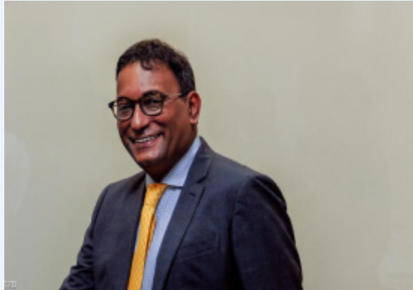
ఈ సముపార్జనతో, వీవర్ సర్వీసెస్ నరళమైన, విశ్వసనీయమైన మరియు మరింత సమగ్రమైన హోమ్ లోన్ సొల్యూషన్లకు యాక్సెస్ను విస్తరించడం ద్వారా ఈ అంతరాన్ని తగ్గించాలని లక్ష్యంగా పెట్టుకుంది.

ముంబై, ఏప్రిల్ 02(భారత శక్తి ప్రతినిధి): వీవర్ సర్వీసెస్ ప్రైవేట్ లిమిటెడ్ సెంట్రమ్ కాపిటల్ లిమిటెడ్ నుండి సెంట్రమ్ హౌసింగ్ ఫైనాన్స్ లిమిటెడ్ లో 75.01శాతం నియంత్రిత వాటాను కొనుగోలు చేసింది. భారతదేశం అంతటా వెనుకబడిన కుటుంబాలకు ఇంటి యాజమాన్యాన్ని మరింత అందుబాటులోకి తీసుకురావాలనే దాని నిబద్ధతను బలోపేతం చేసింది. లావాదేవీ అవసరమైన అన్ని నియంత్రణ మరియు వాటాదారుల ఆమోదాలను పొందింది.