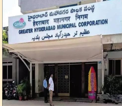
రికవరీ చేస్తున్న అధికారులు, ఆ మొత్తాన్ని వారి పీఆర్ఎస్ (PRAN) ఖాతాల్లో జమ చేయడం లేదనే ఆరోపణలు వెల్లువెత్తుతున్నాయి. "ఏళ్లుగా మా జీతం నుంచి పైనలు కట్ట అవుతున్నాయి..

హైదరాబాద్, ఏప్రిల్ 5 (భారత శక్తి): గ్రేటర్ హైదరాబాద్ మున్సిపల్ కార్పొరేషన్ (జీహెచ్ఎంసీ)లో పనిచేస్తున్న క్లాస్ IV కార్మికుల పరిస్థితి 'అడకతెరలో పోకచెక్క'లా మారింది. ఒకవైపు ఏళ్ల తరబడి చేస్తున్న చాకిరికి గుర్తింపు లేక, మరోవైపు జీతం నుంచి కట్ట అవుతున్న పైనలు ఎటు పోతున్నాయో తెలియక కార్మికులు లబోదిబోమంటున్నారు. తమ న్యాయమైన డిమాండ్లను పరిష్కరించాలని కోరుతూ భాగ్యనగర్ మున్సిపల్ జీహెచ్ఎంసీ ఎంప్లాయిస్ యూనియన్ మంగళవారం సైబల్ ఆఫీసర్ కు వినతి పత్రాలు అందజేసింది. కట్ట చేస్తున్నరు.. కానీ జమ చేస్తలేరు! 2004 తర్వాత విడుదల చేసిన ఉద్యోగుల పరిస్థితి మరి దారుణంగా ఉంది. ప్రతి నెలా వారి జీతాల నుంచి సీపీఎస్ (CPS/NPS) వాటా కింద