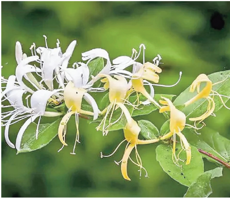
కొమ్ములను తొలగించడం వల్ల కొత్త చిగుళ్లు వచ్చి పూలు ఎక్కువగా పూస్తాయి. ఏడాదికి రెండుసార్లు కంపోస్ట్ లేదా స్టోరీజింగ్ ఫెర్టిలైజర్లను అందించాలి. ఈ మొక్కకు పిండి నల్లి, తెల్లదోమ, బూజు తెగులు వంటివి వచ్చే అవకాశం ఉంది.

కాలంలో ఈ పూలను ప్రేమకు, విశ్వాసానికి చిహ్నంగా, పెళ్లిలో వధువు ఈ పూలను పెట్టుకోవడం శుభసూచకంగానూ భావించేవారట. అందుకేనే మో... పేక్స్ పియర్ వంటి ప్రముఖ కవుల రచనల్లో ఈ పూల ప్రస్తావన ఎక్కువగా కనిపిస్తుంది. తేమ అవసరమే కానీ... ఈ మొక్కకు రోజుకు కనీసం 6 నుంచి 8 గంటల పాటు ఎండ అవసరం. ఎండ తక్కువైతే పూలు తక్కువగా పూస్తాయి. నీరు నిల్వ ఉండని సారవంతమైన నేలలు దీనికి అనుకూలం. ఇవి తీగ జాతి మొక్కలు కాబట్టి, పాకడానికి గోడలు, ఫెన్సింగ్ లేదా ట్రెల్లీస్ వంటి ఆధారాల్ని కల్పించాలి. మొక్క నాటిన కొత్తలో క్రమం తప్పకుండా నీరు పెట్టాలి. ఎదిగిన తర్వాత నేల పైపొర ఆరిపోయినప్పుడు మాత్రమే నీరు పోయాలి. వేర్ల దగ్గర తేమ ఉండాలి కానీ నీరు నిలిచిపోకూడదు. శీతకాలం చివరలో లేదా వసంతకాలం మొదట్లో మొక్కను కత్తిరించాలి. ఎండిపోయిన