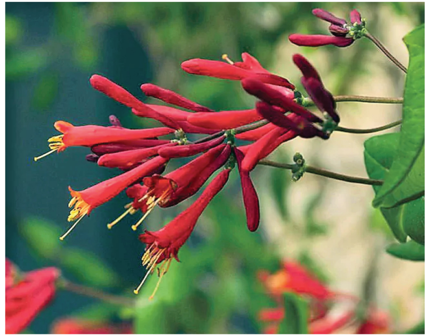
వీటిని దూరం చేయడానికి ఫంగి సైడ్ తో పాటు వేపనూనె పిచికారీ చేయవచ్చు. దానికంటే ముందుగా వ్యాధి సోకిన కొమ్ములు, ఆకులను కత్తిరించి దూరంగా పారేయడం మంచిది. ఈ జాగ్రత్తలతో మొక్క ఆరోగ్యంగా నిండగా పూస్తుంది.