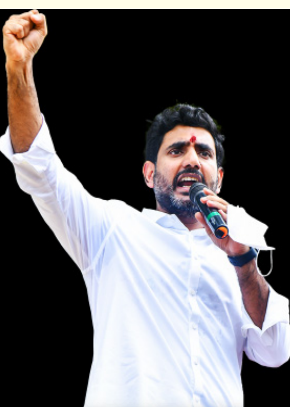
ఏ స్థాయిలో ఉంటాయో యువ గళాన్ని మించి ఏ తీరున ఉంటాయో అన్నది వేచి చూడాల్సి ఉంది. ఏది ఏమైనా లోకేష్ జననాయకుడు అనిపించుకోవాలని చూస్తున్నారు అని అంటున్నారు. నో ఆ దిశగా భారీ కార్యచరణ అయితే టీడీపీ సిద్ధం చేసి పెడుతోంది అని అంటున్నారు

విజయం సాధించడం లోకేష్ ప్రభుత్వంలో మంత్రిగా ఉండడం గడవిన రెండేళ్లలో తన సత్తాను తన శాఖల నిరూపించుకోవడం వంటివి జరుగుతున్నాయి. అయితే ఈసారి అలా కాదు, 2029 ఎన్నికల నేపథ్యంలో లోకేష్ ఇంతకు ఇంత రాజకీయంగా రాటు తేలాలి అంటే జనంలో నిత్యం ఉండేలా పార్టీ రాష్ట్ర స్థాయి పర్ఫెక్షన్లు కార్యక్రమాలు డిజైన్ చేస్తోంది అని అంటున్నారు ఫుల్ ఫోకస్ ఉండేలా : ఏపీలో చంద్రబాబుకు దిగజ నేతగా పేరుంది. ఆయన వారసుడిగా లోకేష్ కి పార్టీలో ఎదురులేదు, యాక్సిడెన్ట్ ఉంది. అయితే జనసామాన్యంలో కూడా దానికి బలమైన ఆమోదం అవసరం అన్నదే పార్టీ పూర్వకర్రల భావనగా ఉంది. చంద్రబాబు తరువాత సిసలైన నాయకుడు పార్టీకి కాదు రాష్ట్రానికి రేపటి రాష్ట్ర భవిష్యత్తుకూ లోకేష్ అని ఏపీలోని ఆరు కోట్ల జనాలు అంతా ఆమోదించేలా ఉండాలి అంటే లోకేష్ మరింతగా జనంలో ఉంటూ తన సత్తాను నిరూపించుకోవాల్సిన అవసరం ఉందని అంటున్నారు. దాని కోసమే పార్టీ ఒక భారీ యాక్సన్ ప్లాన్ ని రూపొందిస్తోంది అని అంటున్నారు. ఒక్క మాటలో చెప్పాలి అంటే లోకేష్ మీదనే ఫుల్ ఫోకస్ ఉండేలా టీడీపీ పథక రచన చేస్తోంది అని అంటున్నారు. పార్టీ అధినేత వేరు, మంత్రిగా సామర్థ్యం వేరు, ఆరు కోట్ల మంది ఉన్న ఒక రాష్ట్రాన్ని నడిపించే అధినేతగా ఉండడం వేరు. జనాలకు ఆ భరోసా కల్పించాల్సిన అవసరం ఉందని అంటున్నారు లోకేష్ లో చంద్రబాబుని చూసుకునేలా ఉండాలంటే మరింతగా లోకేష్ జనంలో ఉంటూ కళ్లపడాల్సి ఉందని అంటున్నారు. పై స్థాయిలో పార్టీ పరంగా పదవులు అందుకోవడం కాకుండా జనం నుంచే వాటికి తగిన ఆమోద ముద్ర వేయించుకోవాలంటే ప్రజల వద్దకు లోకేష్ వెళ్లడమే ఉత్తమ మార్గం అని పార్టీలో చర్చ సాగుతోంది. దాంతో రానున్న కాలంలో లోకేష్ తో రాష్ట్ర స్థాయిలో పర్ఫెక్షన్ చేందుకు భారీ కార్యక్రమాలనే డిజైన్ చేయనున్నారు అని అంటున్నారు. అవి