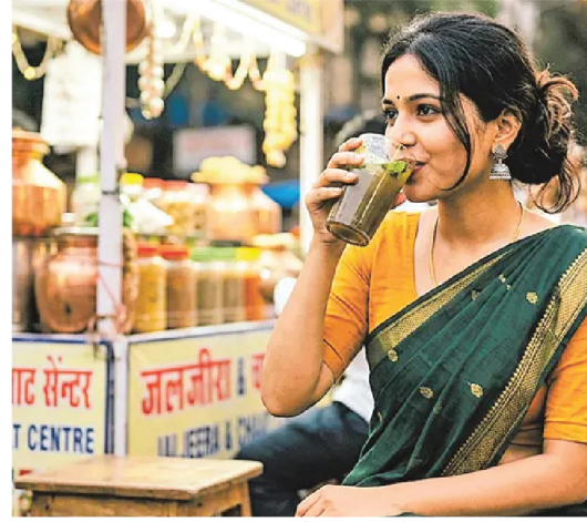
అందిస్తుంది. అందుకే, ఎండలో తిరిగి ఇంటికి రాగానే ఒక గ్లాసు జల్ జీరా తాగి చూడండి. ఆ అలసట తక్షణమే మాయమవుతుంది. వేయించిన జీలకర్ర, కొద్దిగా అల్లం ముక్క, పుదీనా ఆకులు, పచ్చిమిర్చి (అవసరమైతే) కలిపి మెత్తగా రుబ్బాలి. ఈ మిశ్రమాన్ని చల్లని నీటిలో కలిపి, తగినంత నల్ల ఉప్పు, ఆమ్లచూరీ పొడి, నిమ్మరసం కలపాలి. చివరగా కొద్దిగా బాండి చల్లుకుంటే సరి. రుచికరమైన జల్ జీరా తయారైవే. సహజ సిద్ధమైన ఈ పానీయం పెయిన్ కిల్లర్ లానూ పనిచేస్తుంది. జీవక్రియను మెరుగుపరుస్తుంది. ముఖ్యంగా తక్కువ కెలోరీలు ఉండి, ఆకలిని నియంత్రించడంలో సహాయపడటం వల్ల బరువు తగ్గాలనుకునే మహిళలకు మంచి ఎంపిక.

ఎండా కాలం వచ్చిందంటే చాలు దాహంతో అల్లాడిపోతుంటాం. ఈ సమయంలో కృత్రిమమైన కూల్ డ్రింక్స్, సోదాలను తాగే బదులు ఓ గ్లూజల్ జీరా తాగి చూడండి. ఇది దాహం తీర్చడమే కాదు... మరెన్నో ఆరోగ్య ప్రయోజనాలనూ అందిస్తుంది. ముఖ్యంగా ఇందులోని జీలకర్ర జీర్ణ రసాల ఉత్పత్తిని ప్రేరేపిస్తుంది. గ్యాస్, ఎసిడిటీ, కడుపు ఉబ్బరం వంటి సమస్యలను తగ్గిస్తుంది. దీన్ని క్రమం తప్పకుండా తీసుకుంటే శరీరానికి అవసరమైన ఇనుమూ అందుతుంది. పీరియడ్స్ సమయంలో వచ్చే పొత్తికడుపు నొప్పి, తిమ్మిర్ల నుంచి ఈ పానీయం ఉపశమనం కలిగిస్తుంది. ఇక, ఇందులోని నల్ల ఉప్పు... శరీరానికి అవసరమైన ఎలక్ట్రోలైట్లను