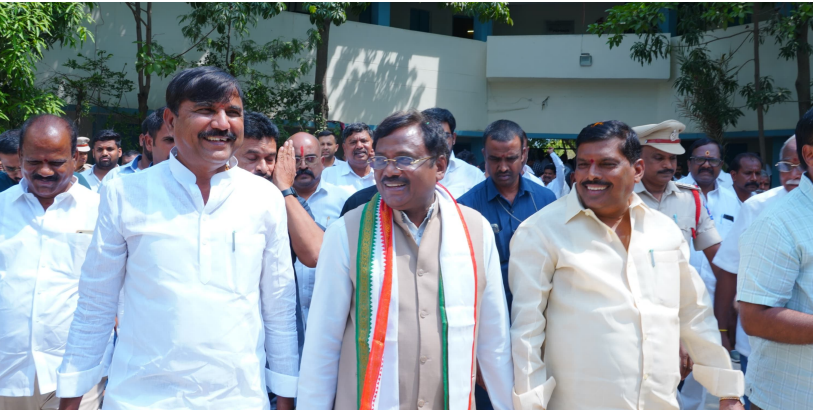
తెల్లూపూర్ మే 19 భారత శక్తి సంగారెడ్డి జిల్లా పటాన్చెరు నియోజకవర్గం తెల్లూపూర్ డివిజన్ ఉస్మాన్ నగర్ పద్దిలోగల కస్తూరిబా గాంధీ బాలిక విద్యాలయంలో 60 లక్షల రూపాయల