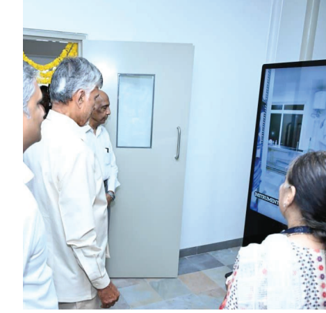
విజయవాడ, మే 1, (భారత శక్తి) : కృష్ణా జిల్లా ప్రజలకు అత్యాధునిక కంటి వైద్య సేవలను అందుబాటులోకి తెచ్చేందుకు గుడ్లవల్లేరులో

సామాన్యులకు ఆర్థిక భారమే అన్నారు. ఐదు రాష్ట్రాలలో అసెంబ్లీ ఎన్నికలు పూర్తయ్యాక పెట్రోల్, డీజిల్, గ్యాస్ ధరలు పెంచడమంటే ప్రజలను మోసం చేయడమేనని మండిపడ్డారు. కేంద్ర ప్రభుత్వం తక్షణమే స్టాంపించి ధరల పెంపు నిర్ణయాన్ని ఉపసంహరించుకోవాలని డిమాండ్ చేశారు. కాగా, వాణిజ్య గ్యాస్ సిలిండర్ ధరలు ఈరోజు భారీగా పెరిగిన విషయం తెలిసింది.