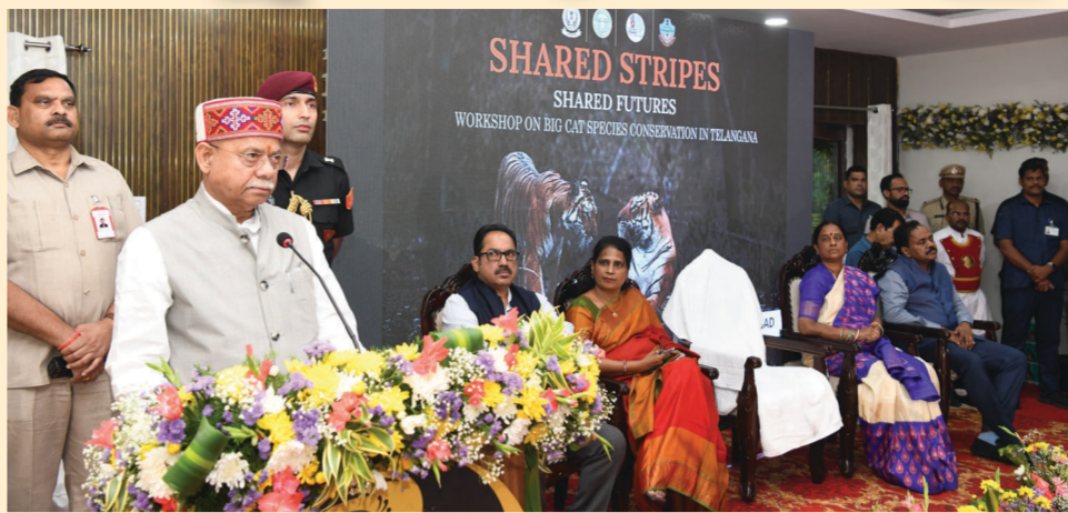
విధానాలు ఆసియా, ఆఫ్రికా దేశాలకు స్ఫూర్తినిస్తున్నాయని చెప్పారు. తెలంగాణలోని అట్రాబాద్, కవ్వాల వంటి పులి సంరక్షణ కేంద్రాలు రాష్ట్ర జీవవైవిధ్యానికి నిలువుటగా నిలిచి, అడవుల పెంపకంలో రాష్ట్ర ప్రభుత్వ కృషి అభినందనీయమని పేర్కొన్నారు.

గ్లోబల్ రోల్ మోడల్ గా భారత్ ప్రధాని నరేంద్ర మోదీ నేతృత్వంలో ప్రారంభమైన 'ఇంటర్నేషనల్ బిగ్ క్యాట్ అలయన్స్' (IBCA) ద్వారా ప్రపంచ దేశాలన్నీ పరిశోధనలు, అనుభవాలను పంచుకునే అవకాశం కలిగిందని గవర్నర్ తెలిపారు. భారత్ అనుసరిస్తున్న