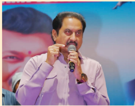
పటాన్చెరు, మే 11 (భారత శక్తి) : ప్రస్తుత సమాజంలో స్వీయ రక్షణ కోసం విద్యార్థినిలు, మహిళలు తప్పకుండా కరాటే నేర్చుకోవాలి..