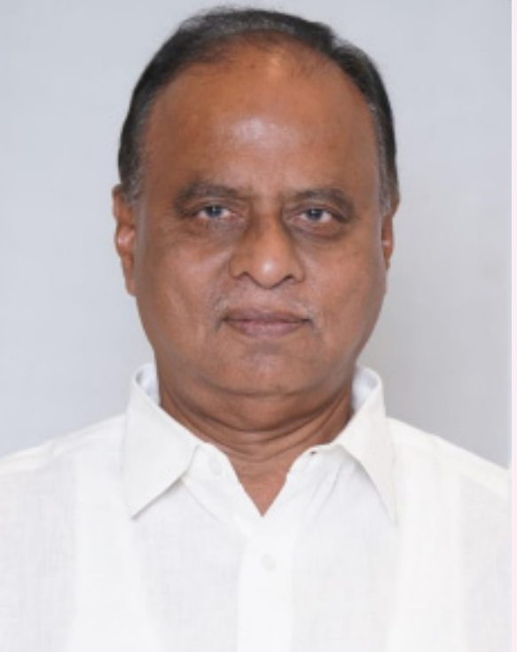
విరుచుకుపడ్డారు. కోవూరు నియోజకవర్గం ప్రజలు తెలివైన వారని, వచ్చే ఎన్నికల్లోనూ ప్రసన్న గెలవలేంటూ సవాల్ విసిరారు. అంతేకాదు కోవూరు నియోజకవర్గంలో వైసీపీ ఏర్పాటు చేసిన ఫ్లెక్సిబిలిటీ కూడా తొలగించడం వివాదం గా మారింది. మొత్తం మీద ఎన్నికలకు మూడేళ్ల ముందే కోవూరు రాజకీయాలతో నలనల మందుతోంది.