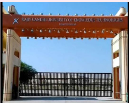
విద్యార్థుల భవిష్యత్తును దృష్టిలో ఉంచుకుని తీసుకున్న ఈ నిర్ణయానికి సహకరించాలని అధికారులు విద్యార్థులు, తల్లిదండ్రులను కోరారు. విద్యా ప్రమాణాల పెంపు, క్రమశిక్షణ పరిరక్షణే ఈ చర్య వెనుక ప్రధాన ఉద్దేశమని వివరించారు.

నిర్మల్ జిల్లా ప్రతినీధి, జూన్ 23: (భారత శక్తి) బాసరలోని రాజీవ్ గాంధీ యూనివర్సిటీ ఆఫ్ నాటల్ టెక్నాలజీస్ (ఆర్టియూజీటీ) బాసర (ట్రిపుల్ ఐటీ)లో విద్యార్థుల మొబైల్ ఫోన్ వినియోగంపై అధికారులు కీలక నిర్ణయం తీసుకున్నారు. విద్యార్థుల విద్యాభ్యాసానికి అంతరాయం కలగకుండా ఉండేందుకు మెస్, ల్యాప్, తరగతి గదుల్లో మొబైల్ ఫోన్ వినియోగాన్ని నిషేధిస్తున్నట్లు ప్రకటించారు. విద్యార్థులు పాఠాలపై పూర్తి దృష్టి సారించేందుకు, విద్యా వాతావరణాన్ని మరింత మెరుగుపర్చేందుకు ఈ నిర్ణయం తీసుకున్నట్లు అధికారులు తెలిపారు. అయితే తరగతులు ముగిసిన అనంతరం హాస్టల్ గదుల్లో మొబైల్ ఫోన్లను వినియోగించుకోవచ్చని స్పష్టం చేశారు. మొబైల్ ఫోన్లపై పూర్తి నిషేధం విధించినట్లు కొన్ని వర్గాలు సోషల్ మీడియాలో తప్పుడు ప్రచారం చేస్తున్నాయని, ఇది వాస్తవానికి విరుద్ధమని సంస్థ అధికారులు పేర్కొన్నారు. ట్రిపుల్ ఐటీ ప్రతిష్ఠను దెబ్బతీసేలా కొందరు అసత్య ప్రచారాలు చేస్తున్నారని వారు ఆవేదన వ్యక్తం చేశారు.