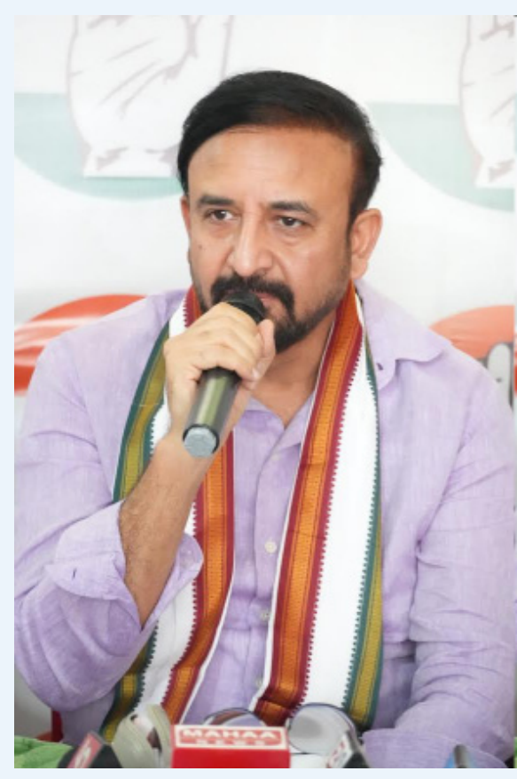
సమయం పడుతుంది. ఒకప్పుడు ఫోన్ పే, గూగుల్ పే వంటి డిజిటల్ సేవలు కూడా కొత్తగానే అనిపించాయి. నేడు ప్రతి ఒక్కరూ వాటిని వినియోగిస్తున్నారు. అదే విధంగా రైతులు కూడా ఈ వ్యవస్థకు అలవాటు పడతారు. యాప్ లో ఎక్కడైనా సాంకేతిక సమస్యలు ఉంటే వాటిని పరిష్కరించేందుకు ప్రభుత్వం నిరంతరం చర్యలు తీసుకుంటోంది. రైతులకు మరింత సౌకర్యంగా సేవలు అందించేందుకు అవసరమైన మార్పులు కూడా చేపడుతోంది.

కామారెడ్డి జిల్లా (భారత శక్తి ప్రతినీధి) జూన్ 23: కామారెడ్డి జిల్లా ఎల్లారెడ్డి నియోజకవర్గంలో యూరియా కొరత లేదు. ఎమ్మెల్యే మదన్ మోహన్ అన్నారు. విషయం తెలిసిన వెంటనే వ్యవసాయ శాఖ అధికారులతో సమీక్ష నిర్వహించి పరిస్థితిని పర్యవేక్షించారు. రైతులకు ఎలాంటి ఇబ్బందులు కలగకుండా ఉండేందుకు మండల వ్యవసాయ అధికారులు, వ్యవసాయ శాఖ సిబ్బంది, నా కార్యాలయ సిబ్బంది వెంటనే చర్యలు చేపట్టారు.