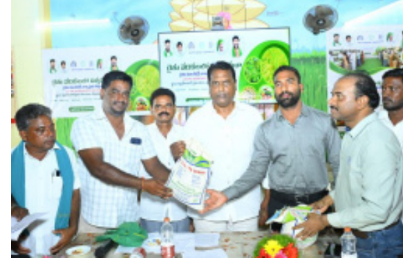
31 వరకు రైతు వేదికల్లో విత్తన మేళాలు నిర్వహిస్తామని తెలిపారు. ప్రభుత్వం సూచించిన విత్తనాలు రైతులకు అందుబాటులో ఉన్నాయని పేర్కొన్నారు.