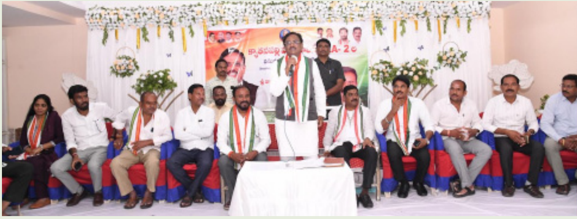
మంచీర్యాల ప్రతినిధి, జూన్ 29 (భారత శక్తి):