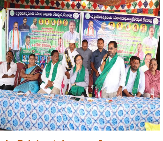
- ప్రతి రైతుకు ఎరువులు అందిస్తాం

ఇల్లం ఎమ్మెల్యే కోరం కనకయ్య మాట్లాడుతూ ప్రతి రైతుకు తగినంత ఎరువులు అందించడమే ప్రభుత్వ లక్ష్యమని అన్నారు. రైతులకు ఎరువుల కొరత తలెత్తకుండా ప్రభుత్వం నిరంతరం చర్యలు తీసుకుంటోందని తెలిపారు. గత సీజన్లో రికార్డు స్థాయిలో మొక్కజొన్నను 2400 మద్దుత ధరకు కొనుగోలు చేసి, 1800 కు ప్రభుత్వం విక్రయించిందని సస్యాన్ని ప్రభుత్వమే భరించి రైతులకు అండగా నిలిచినట్లు తెలిపారు. అయినప్పటికీ ప్రభుత్వంపై కొందరు తప్పుడు ప్రచారాలు చేపడుతున్నారు. రైతుల సంక్షేమం కోసం ప్రభుత్వం అనేక సంక్షేమ, అభివృద్ధి కార్యక్రమాలను అమలు చేస్తోందని, ఫెర్టిలైజర్ బుకింగ్ యాప్ ద్వారా రైతులు ఇంటి నుంచే యూరియాను బుక్ చేసుకునే అవకాశం కల్పించడం కూడా అందులో భాగమేనన్నారు. రైతులు సంప్రదించే వంటలతో పాటు ప్రత్యామ్నాయ పంటలను సాగు చేస్తూ ఆదాయాన్ని పెంచుకోవాలని సూచించారు. అనంతరం