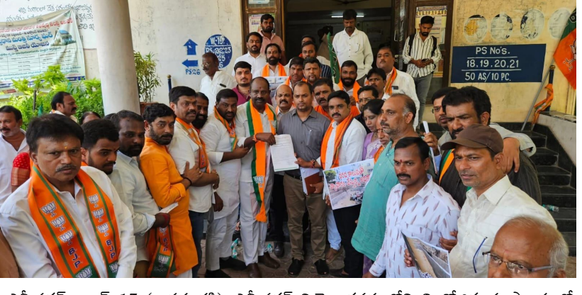
ఎల్సీసీ, జూన్ 17 (భారత శక్తి): ఎల్సీసీ నియోజకవర్గంలోని లింగ్జిగూడ ప్రాంతంలో జనప్రియ అపార్ట్మెంట్స్ పక్కన భాగంలో జిహెచ్ఎంసీ అధికారుల కమన్స్ లో కొందరు ప్రైవేట్