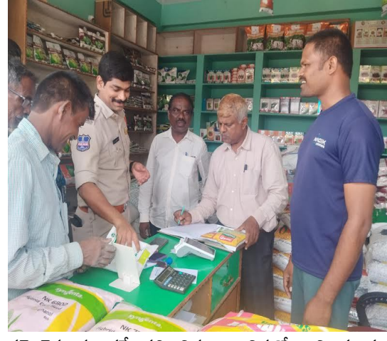
సమాధాన తర్వాతనే పత్తి విత్తనాలు విక్రయం చేయాలని మండల వ్యవసాయ అధికారి రైతులకు సూచించారు.

విత్తనాలు కొనుగోలు చేసే రైతులకు విధిగా లాల్ నెంబర్ తో కూడిన వివరాలతో రసీదు ఇవ్వాలని అట్టి రసీదును పంపి కాలం అయిపోయే వరకు రైతులు భద్రపరుచుకోవాలని రైతులకు వివరించాలని సూచించారు. రైతులు ఎట్టి పరిస్థితుల్లో లాజ్ పత్తి విత్తనాలు, బిజీ 3 పత్తి విత్తనాలను వాడకూడదని అట్టి విత్తనాలు గ్రామాలలో సంచరించే అమ్మకాలు జరిపే వ్యక్తులు వివరాలు వెంటనే పోలీసు అధికారులకు కానీ వ్యవసాయ అధికారులకు గాని సమాచారం ఇవ్వాలని కోరారు. రైతులు విత్తనాలను అమ్మకం లైసెన్స్ కలిగిన డీలర్ల వద్ద మాత్రమే కొనుగోలు చేయాలని సూచించారు. అదేవిధంగా రైతులు పత్తి విత్తనాలను తొందరపడి నాలవద్ద 60- 70 మిల్లీమీటర్ల వర్షపాతం