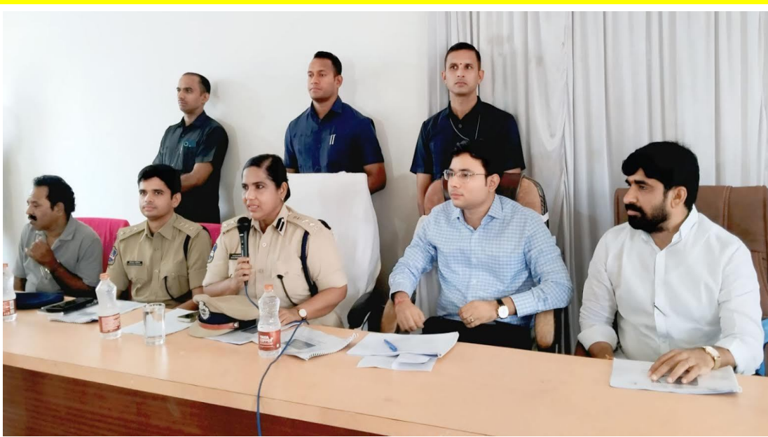
పనిచేయాలని సూచించారు. ప్రతి వార్డులో నెలకొన్న సమస్యలను గుర్తించి పరిష్కరించే దిశగా కొన్ని అంశాలపై చర్చించారు. సమస్యలు ఎదురైతే ఉన్నతాధికారుల దృష్టికి తీసుకెళ్లి పరిష్కారం సాధించాలని పేర్కొన్నారు.