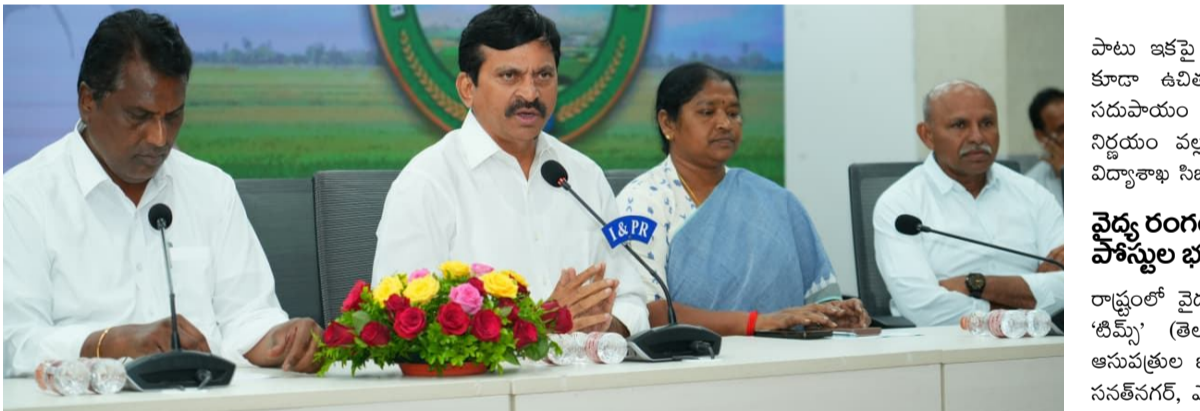
పాటు ఇకపై ఉపాధ్యాయులు, అధ్యాపకులు, ఇతర సిబ్బందికి కూడా ఉచితంగా అల్పాహారం, పాలు, మధ్య్యాహ్న భోజన సదుపాయం కల్పించాలని నిర్ణయించింది. ఈ చారిత్రాత్మక నిర్ణయం వల్ల రాష్ట్రవ్యాప్తంగా సుమారు 1.5 లక్షల మంది విద్యార్థులు నిబ్బందికి నేరగా ప్రయోజనం చేకూరనుంది.