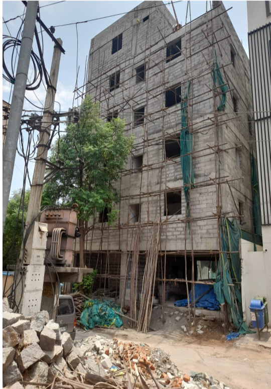
వ్యవహరిస్తున్నారని ఆరోపణలు వస్తున్నాయి.

స్థానికులు వాపోతున్నారు. ప్రత్యేక టౌన్ ప్లానింగ్ (ఎస్.టి.ఎఫ్) తీరుల విమర్శలు నగరంలో అక్రమ నిర్మాణాలను అరికట్టేందుకు ఏర్పాటైన ప్రత్యేక టౌన్ ప్లానింగ్ (ఎస్.టి.ఎఫ్) ఇంచార్జ్గా వ్యవహరిస్తున్న టౌన్ ప్లానింగ్ సిపిపై కూడా విమర్శలు వ్యక్తమవుతున్నాయి. నిబంధనలు ఉల్లంఘించిన భవనాలపై చర్యలు తీసుకోవడంలో పక్షపాత వైఖరి ప్రదర్శిస్తున్నారని, లబ్ధి చేకూర్చిన వారికి ఒకలా, లేని వారికి మరొకలా