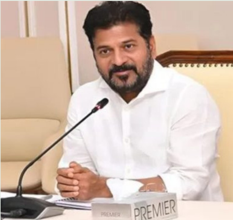
చేశారు. ప్రభుత్వం నకాలంలో నిధులు విడుదల చేసినప్పటికీ, ఉద్యోగులకు ఇబ్బందులకు గురిచేసే ఏజెన్సీలపై కఠిన చర్యలు తీసుకోవాలని అధికారులకు తేల్చి చెప్పారు.

హైదరాబాద్: ప్రభుత్వ ఉద్యోగులతో సమానంగా కాంట్రాక్టు, ఔట్ సోర్సింగ్ ఉద్యోగులకు కూడా ప్రతి నెల ఒకటో తారీఖున జీతాలు అందేలా చూడాలని, ఇందుకోసం వివిధ విభాగాల్లో పనిచేస్తున్న సదరు ఉద్యోగుల వివరాలు, వారి జీతాలు, బ్యాంక్ ఖాతాల సమాచారాన్ని పూర్తి స్థాయిలో డిజిటలైజ్ చేయాలని సీఎం రేవంత్ రెడ్డి స్పష్టం చేశారు. రాష్ట్రంలోని కాంట్రాక్టు, ఔట్ సోర్సింగ్ ఉద్యోగుల నమస్కరణపై ముఖ్యమంత్రి ఉన్నతాధికారులతో ఉన్నత స్థాయి సమీక్షా సమావేశం నిర్వహించారు. ఈ సందర్భంగా సీఎం మాట్లాడుతూ, రాష్ట్రంలో పరిపాలన వ్యవస్థను పూర్తి స్థాయిలో డిజిటలైజ్ చేస్తూ 'డిజిటల్ గవర్నెన్స్' దిశగా చట్టాలను రూపొందించాలని అధికారులను ఆదేశించారు. ప్రజలకు మెరుగైన సేవలు అందించడంతో పాటు సంక్షేమ పథకాలను నేరుగా లబ్ధిదారులకు చేర్చేందుకు ఈ విధానం ఎంతో దోహదపడుతుందని ఆయన పేర్కొన్నారు. అదే విధంగా కాంట్రాక్ట్, ఔట్ సోర్సింగ్ ఏజెన్సీల తీరుపై సీఎం తీవ్ర ఆగ్రహం వ్యక్తం