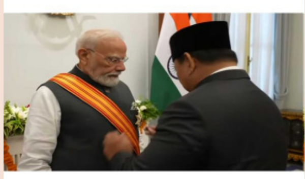
ఎక్కువ ఉండడం, ప్రకృతి విపత్తులు వంటి సమస్యల నేపథ్యంలో వాటిని అధిగమించడానికి భారత్ అనుసరించే పద్ధతులను తాము కూడా పాటిస్తామన్నారు. మోదీ చేపట్టే కార్యక్రమాలలో దీనిపైనా కాపీరైట్ (లేకపోవడం) సంతోషంగా ఉండంటూ చిరునవ్వులు చిందించారు.

రామాయణ కాలం నుంచి భారత్-ఇండోనేసియా మధ్య ద్వైపాక్షిక సంబంధాలు ఉన్నాయని ప్రధాని నరేంద్ర మోదీ పేర్కొన్నారు. ఈ బంధాన్ని మరింత ముందుకు తీసుకువెళ్లడానికి ఇరుదేశాలు కృషి చేస్తున్నాయన్నారు. అక్కడి పార్లమెంటులో మోదీ ప్రసంగిస్తూ.. ఇరుదేశాల మధ్య బలమైన సహకారం ఇండో-వసిఫిక్ ప్రాంతంలో శాంతి, స్థిరత్వం, శ్రేయస్సుకు దోహదపడుతుందన్నారు. ఇండోనేసియా ఎన్నికల వ్యవస్థను ఆధునికీకరించడంలో సహాయపడటానికి, ప్రత్యేకమైన ఎలక్ట్రానిక్ ఓటింగ్ మెషీన్ల అభివృద్ధికి భారత్ సాయం చేస్తుందన్నారు. పహల్గా ఉగ్ర ఘటన సమయంలో భారత్ కు అందగా ఉన్నందుకు కృతజ్ఞతలు తెలిపారు. అయితే, భారత్ ప్రభుత్వ పథకాలను కాపీ కొట్టామని ఇండోనేసియా అధ్యక్షుడు ప్రబోవో సుబియాం అంతకుముందు చెప్పిన విషయాన్ని ప్రస్తావించిన మోదీ.. స్నేహితుల మధ్య 'కాపీరైట్' ఉండవని నవ్వుతూ వ్యాఖ్యానించారు.