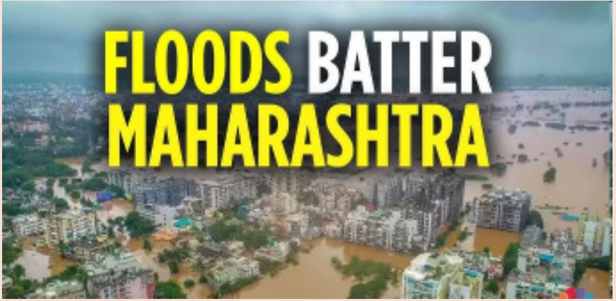
నీరు ఉధృతంగా ప్రవహిస్తుండటంతో ప్రమాదాలు పొంచి ఉన్నాయి.

దాల్చాయి. గత 48 గంటలూ గురుతున్న అసాధారణ భారీ వర్షాలకు ఆర్థిక రాజధాని ముంబైలో పాటు సాంస్కృతిక రాజధాని పుణె నగరం పూర్తిగా స్తంభిల్చిపోయాయి. ముఖ్యంగా పుణె జిల్లాలోని పశ్చిమ కనుమలు పరిధిలో మేఘమధనం జరుగుతోంది. ఘాట్ సెక్షన్లోని పలు వాతావరణ కేంద్రాల్లో ఇప్పటికే 200 మిమీ కంటే ఎక్కువ వర్షపాతం నమోదు కాగా, పుణె నగర పరిసర ప్రాంతాల్లో నగరము 100 మిమీ మార్పును దాటిసింది. ఈ జలప్రళయం కారణంగా ఇటు పుణె, అటు ముంబై, కొంకణ్ రీజియన్లలో జనజీవనం పూర్తిగా అస్తవ్యస్తమైంది. భారత వాతావరణ శాఖ ముంబై, రాణి, పాల్ఘర్, రామగఢ్ జిల్లాలకు అత్యంత ప్రమాదకరమైన రెడ్ అలర్ట్ జారీ చేసింది.