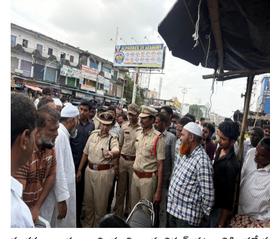
కలగకుండా చూడాలని సూచించారు. నిర్మల్ పట్టణానికి ప్రత్యేక ట్రాఫిక్ పోలీస్ స్టేషన్ మంజూరైనప్పటికీ, పూర్తిస్థాయిలో ప్రారంభం కావడానికి కొంత సమయం పడుతుందని తెలిపారు. అప్పటి వరకు ప్రజలందరూ ట్రాఫిక్ నిబంధనలను పాటిస్తూ పోలీసు శాఖకు సహకరించాలని జిల్లా ఎస్.పి. విజ్ఞప్తి చేశారు.