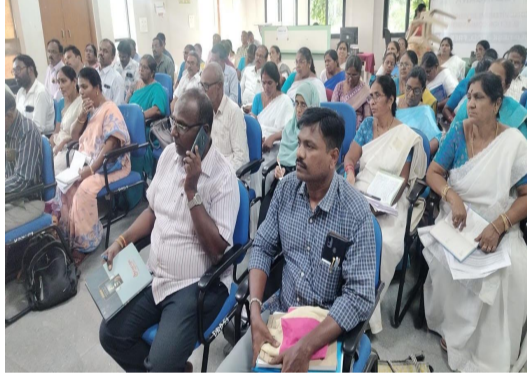
అంశాలపై సమగ్రంగా సమీక్షించారు. జిల్లాలో ప్రతి ఆరోగ్య కేంద్రం పరిధిలో ప్రజలకు ప్రభుత్వ ఆరోగ్య సేవలు సమర్థవంతంగా అందేలా చర్యలు తీసుకోవాలని, రికార్డులు ఎప్పటికప్పుడు నవీకరించాలని, ఫీల్డ్ పర్యవేక్షణను మరింత బలోపేతం చేయాలని అధికారులకు సూచించారు. అలాగే పర్యవేక్షణలో మార్పుల నివారణ చర్యలు, పారిశుధ్య కార్యక్రమాల మృదులు ప్రజల్లో ఆరోగ్య అవగాహన కార్యక్రమాలను విస్తృతంగా నిర్వహించాలని ఆదేశించారు. ఈ సమావేశంలో పాల్గొన్న అధికారులు జిల్లా వైద్య, ఆరోగ్య